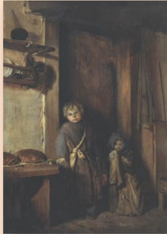
П. Чистяков «Дети нищие»