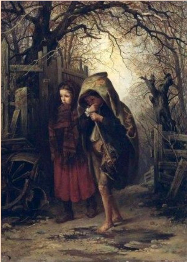
В. Якоби «Осень»