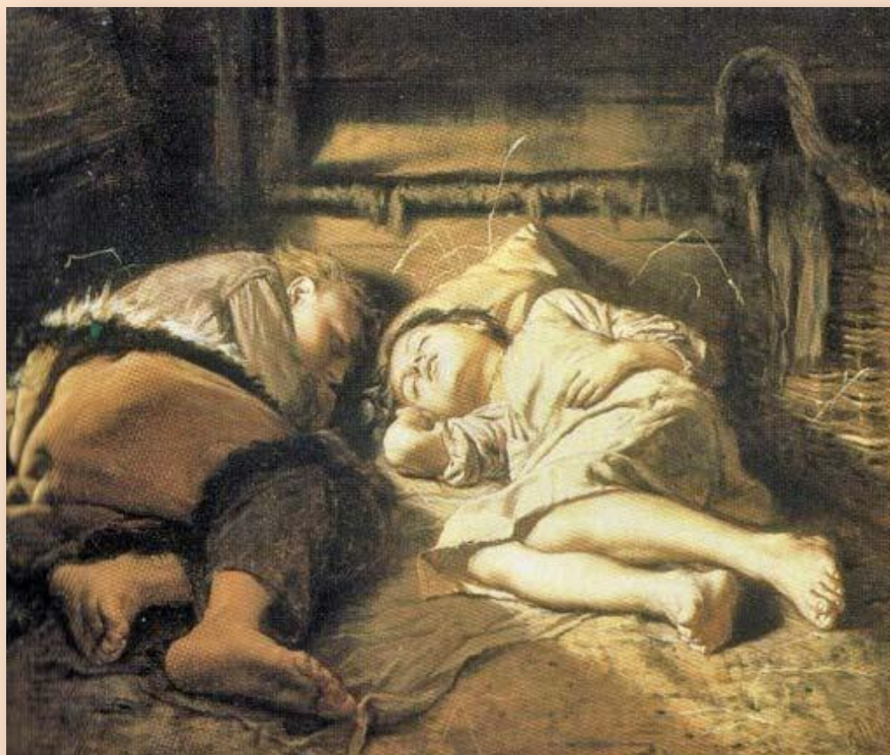
В. Перов «Спящие дети»