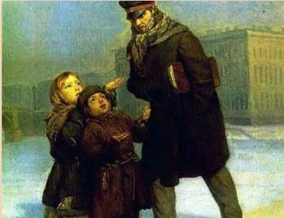
Ф. Журавлёв «Дети-нищие»