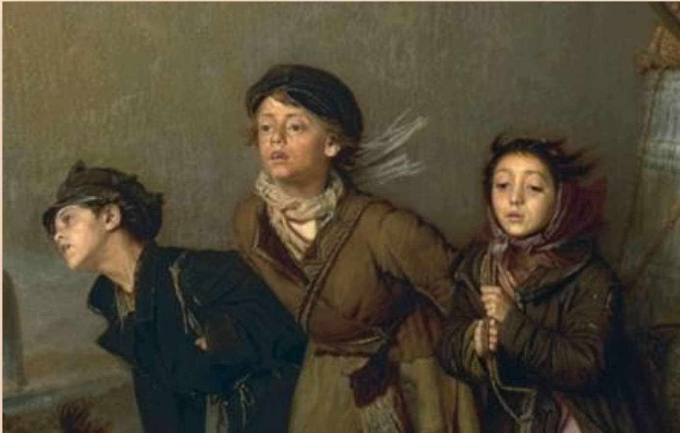
В. Перов «Тройка»