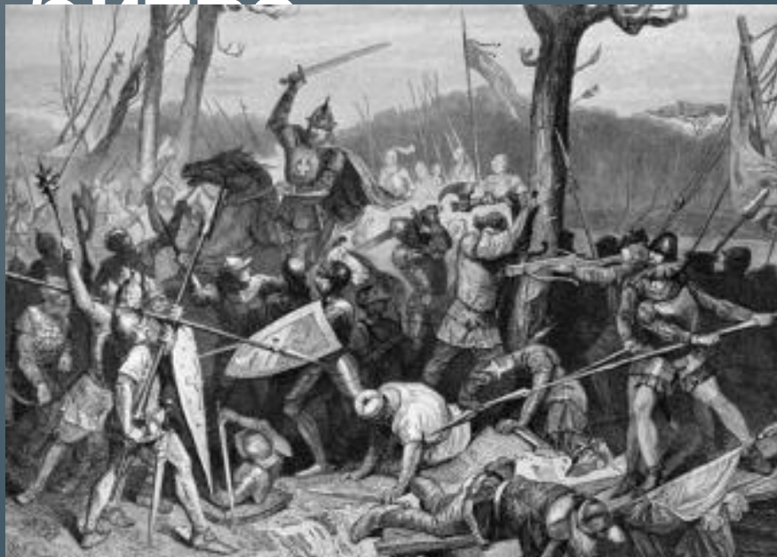
В. Васнецова "Битва князя Александра Невского со шведами на Неве"