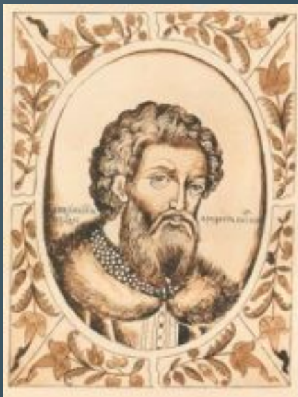
Н. Рерих "Александр Невский"