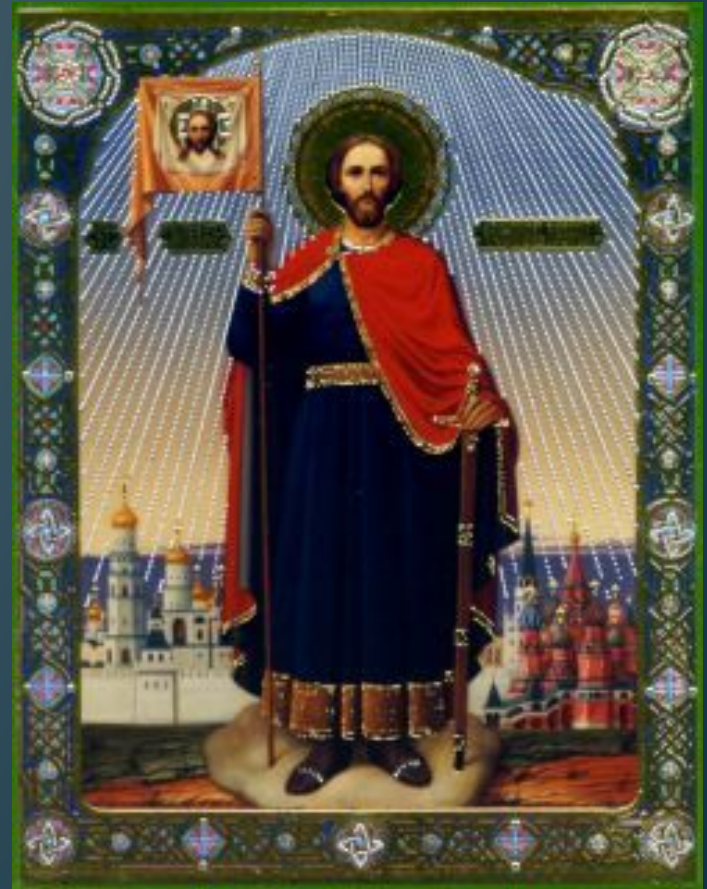
Икона благоверного князя Александра Невского.

С тех пор Александр Невский живет в памяти народной: в 1547 году он был прославлен на московском соборе и причислен к лику святых.