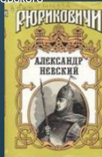
Рюриковичи: Династия в романах