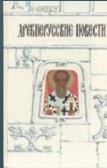
"Житие Александра Невского"