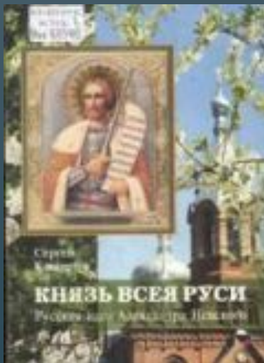
Каширин С. И. Князь всея Руси.