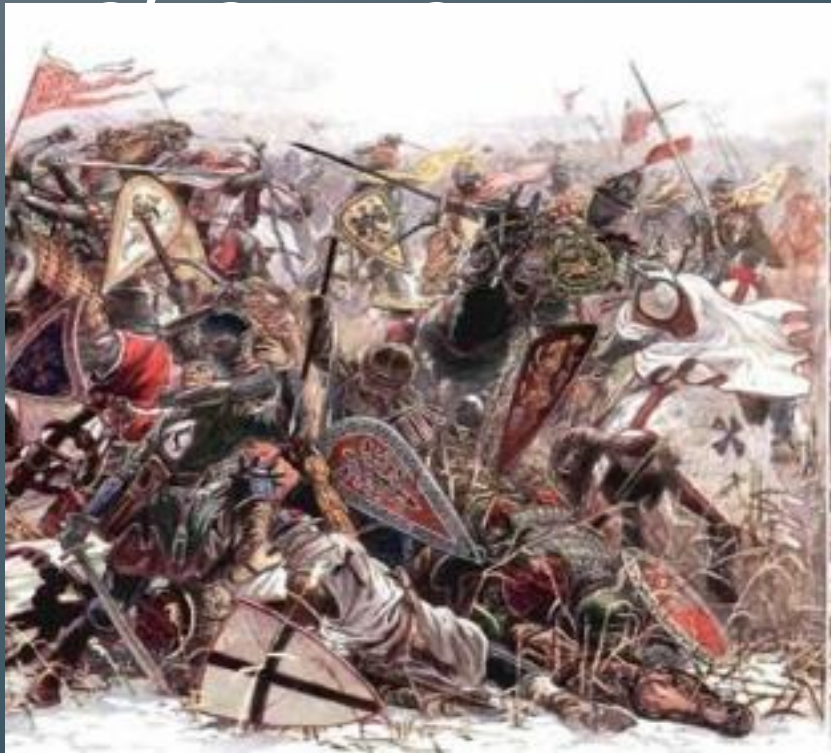
Щербаков А, Дзысь И. «Ледовое побоище»

...Уже смешались люди, кони, Мечи, секиры, топоры, А князь по-прежнему спокойно Следил за битвою с горы. ...И только выждав, чтоб ливонцы, Смешав ряды, втянулись в бой, Он, полыхнул мечом на солнце, Повел дружину за собой. По льду летели с лязгом, громом, К мохнатым гривам наклонясь; И первым на коне огромном В немецкий строй врубился князь. Стоял суровый беспорядок Железа, крови и воды. На месте рыцарских отрядов Легли кровавые следы.