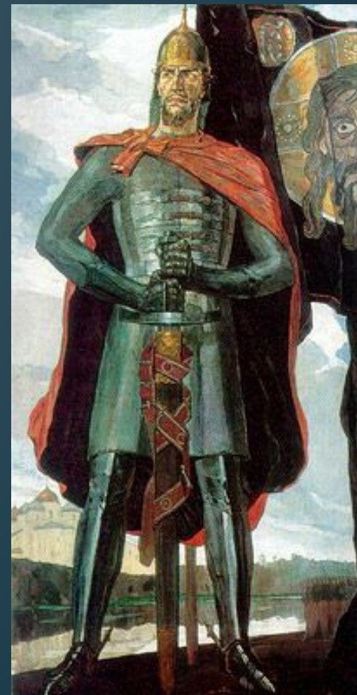
Корин П. Александр Невский