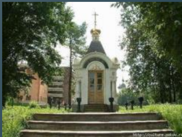
Часовня Александра Невского. Великие Луки