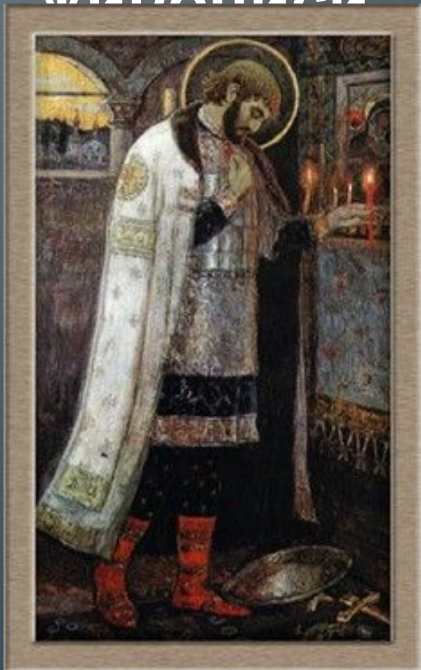
Нестеров М. Александр Невский