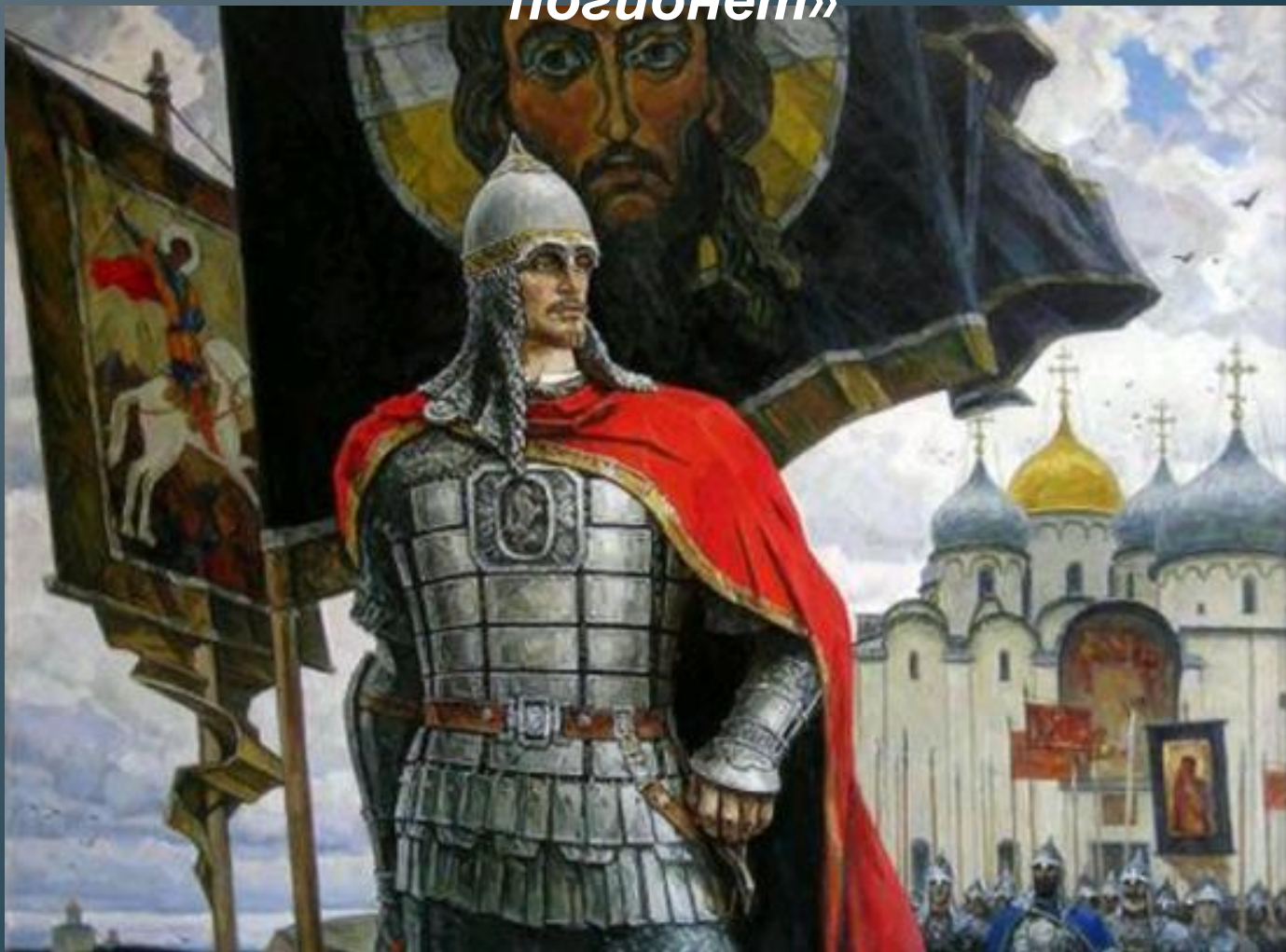
Ю. Пантюхин. Александр Невский

«Кто с мечом к нам придет, тот от меча и погибнет»