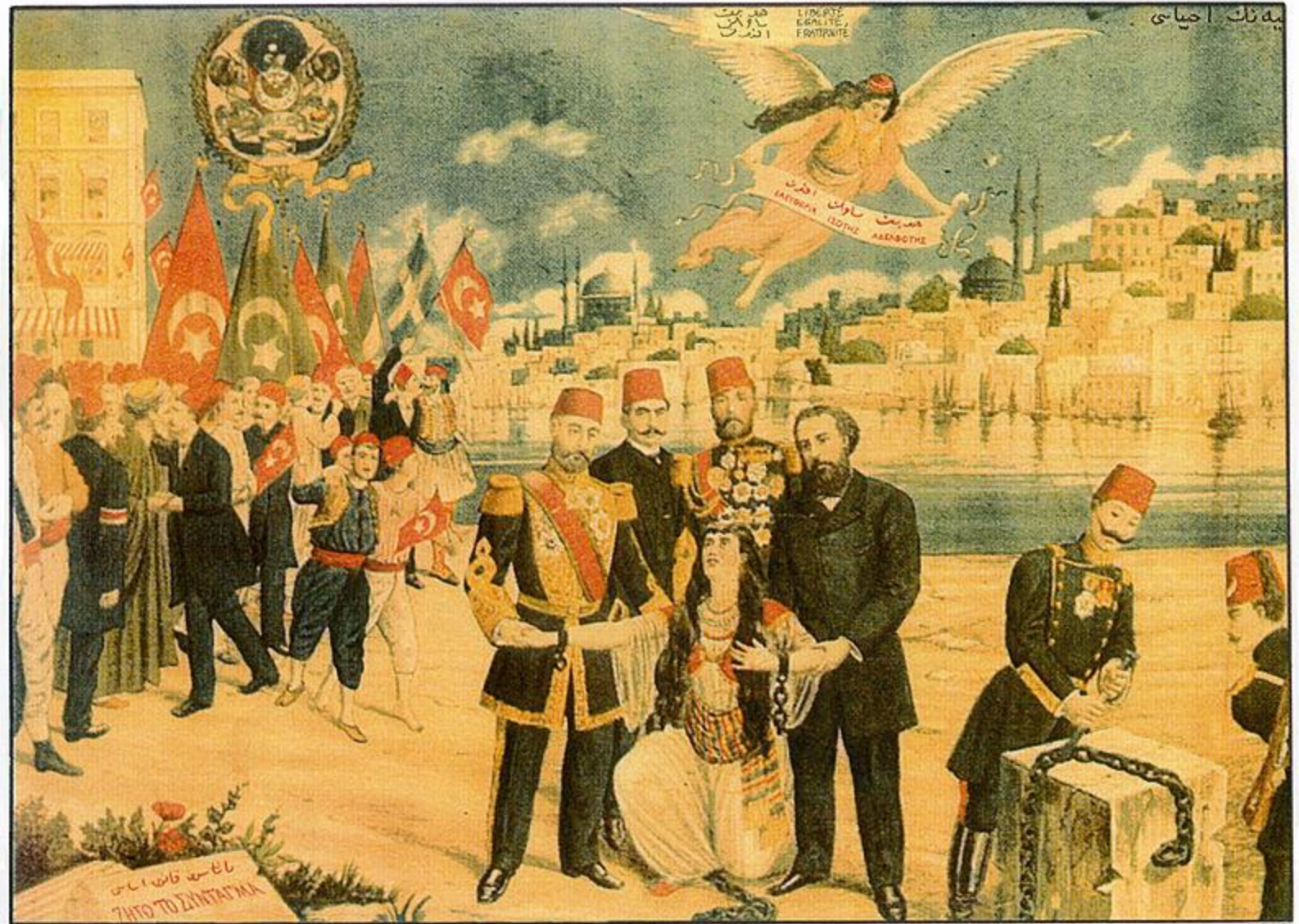
Didar-i Hürriyet kurtarılıyor (la Liberté sauvée) : carte postale de 1895, saluant la constitution ottomane du 23 novembre 1876, figurant le sultan Abdul-Hamid, les différents millets de l'empire (Turcs avec les drapeaux rouges, Arabes avec les drapeaux verts, Arméniens, Grecs) et la Turquie (non voilée) se relevant de ses chaînes. L'ange symbolisant l'émancipation porte une écharpe avec les mentions : « Liberté, Égalité, Fraternité » en turc et grec.

Турецкая открытка событий 1876 года. В центре стоят султан Абдул-Хамид II , Великий визирь и другие первые лица империи. Женщина в центре символизирует Турцию, которая скидывает оковы рабства. Летающий сверху ангел является намёком на Французскую революцию и её девиз «Свобода, равенство, братство». Все это происходит на фоне Стамбула