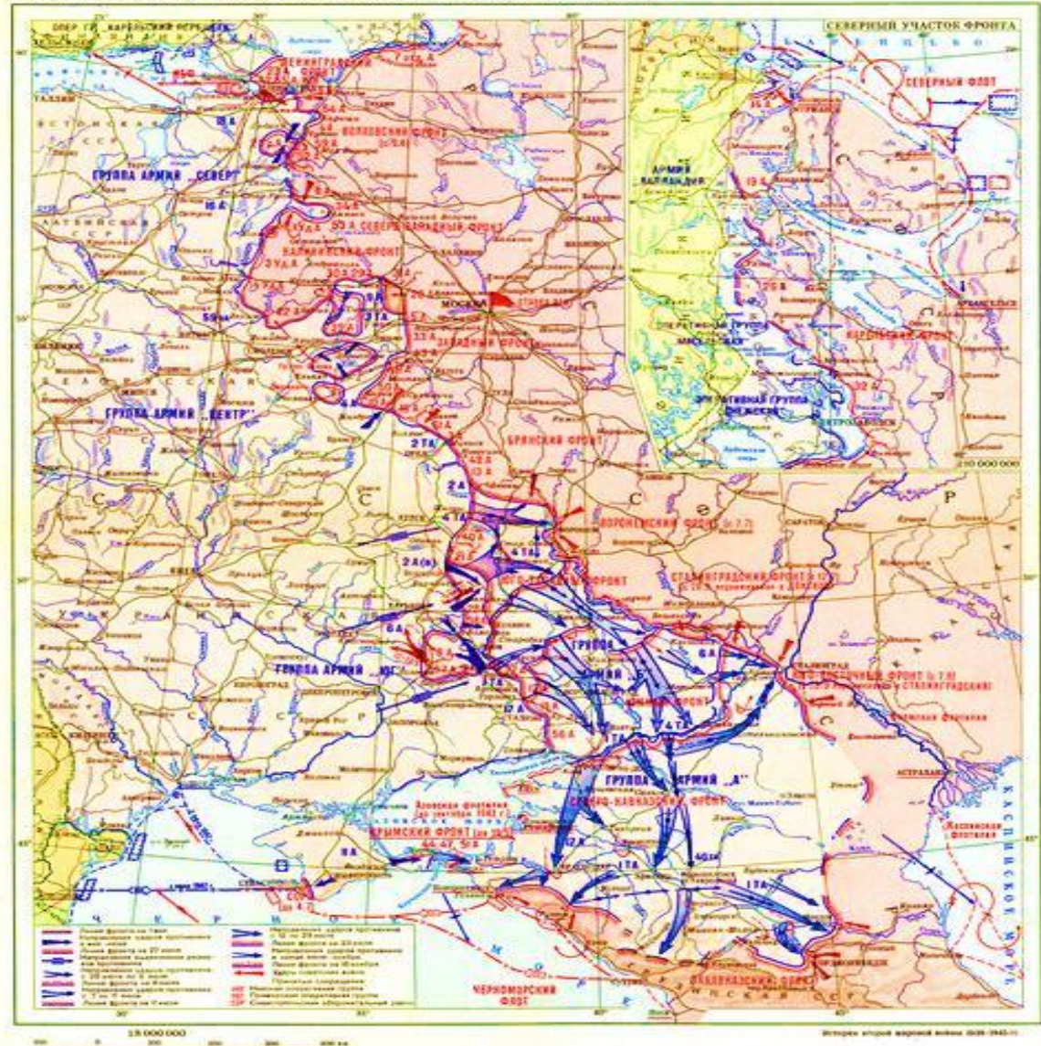
6 ОБЩИЙ ХОД ВОЕННЫХ ДЕЙСТВИЙ НА СОВЕТСКО-ГЕРМАНСКОМ ФРОНТЕ. Май-ноябрь 1942 г.