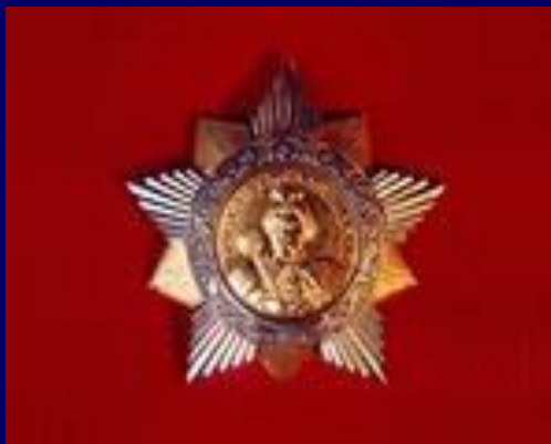
Орден Богдана Хмельницкого