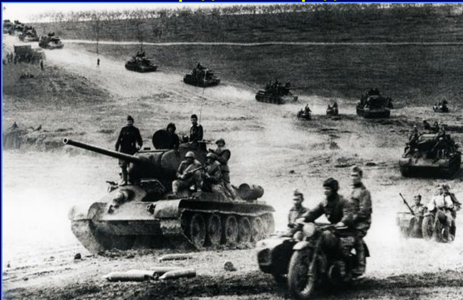
Танковая атака. 1942 г. Сталинград