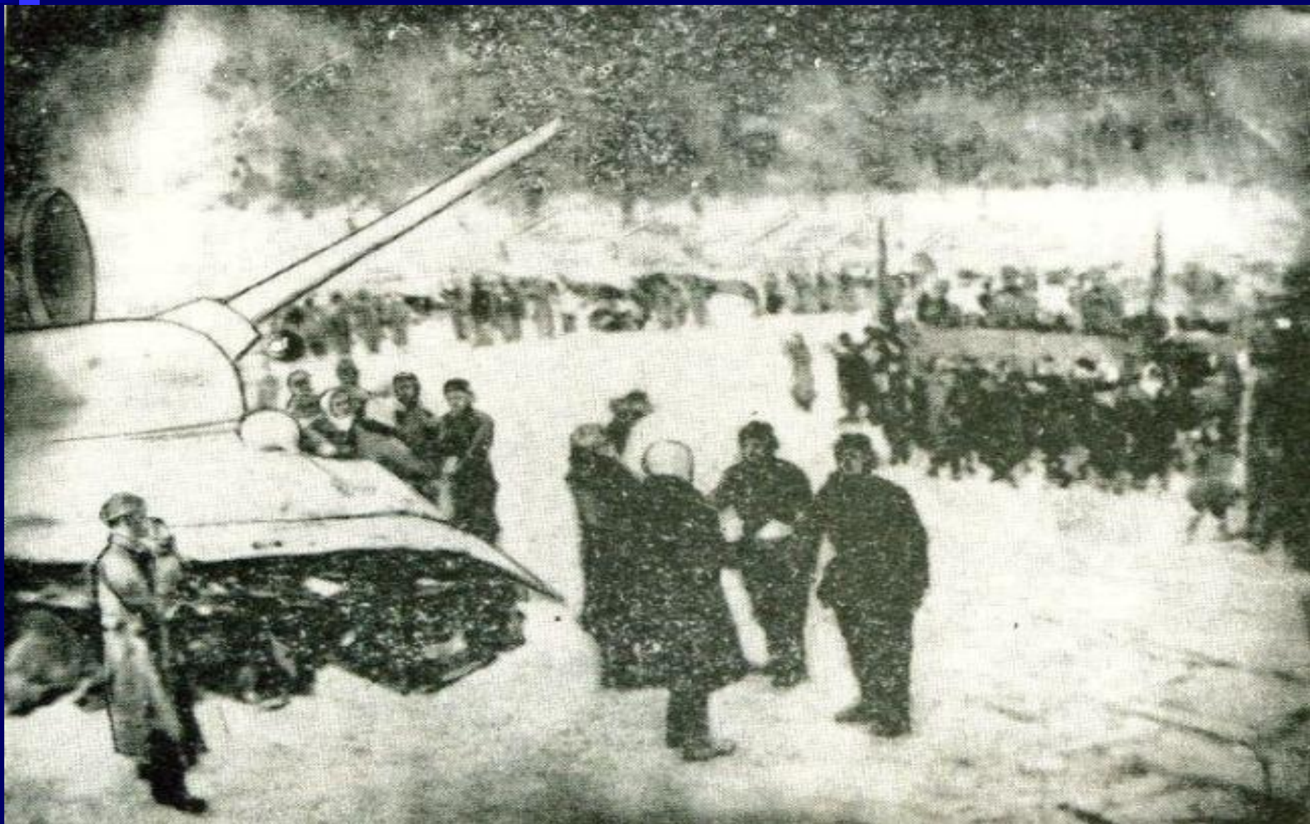
Передача танковой колонны Тамбовский колхозник. Масло.