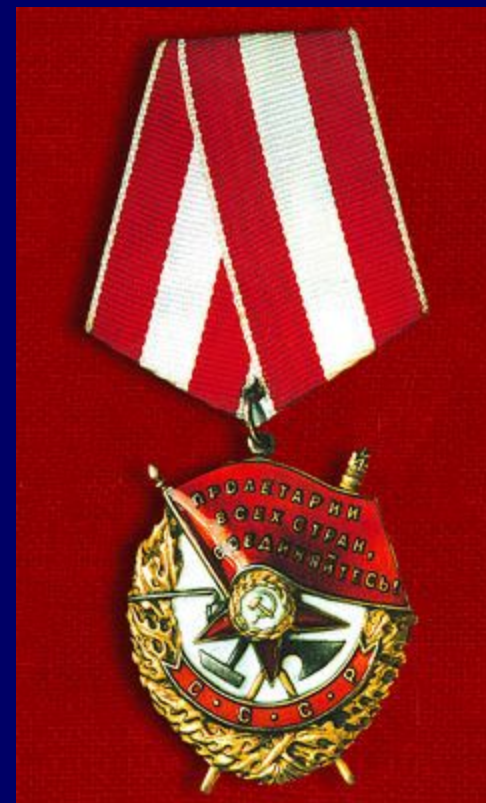
Орден Красного знамени