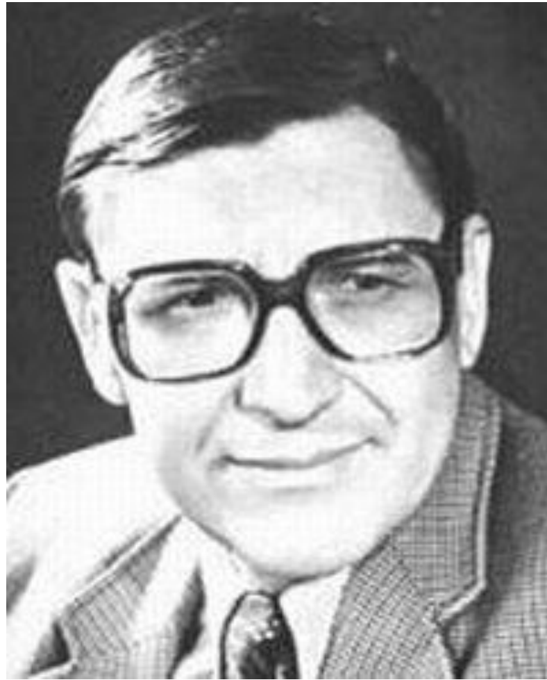
Евгений Серафимович Велтистов «Приключения электроника»