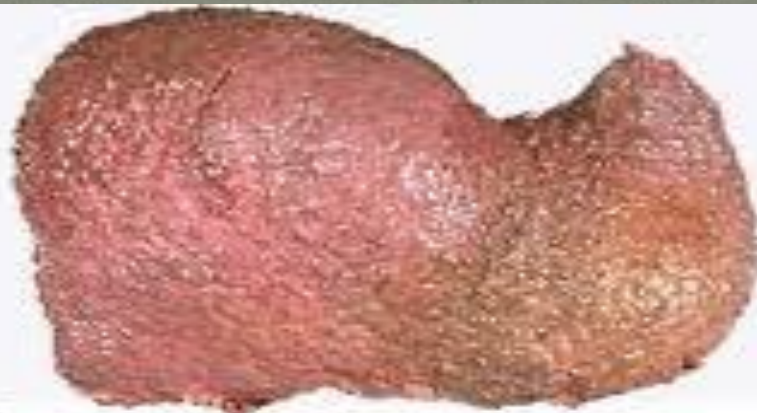
Печень пораженная алкоголем