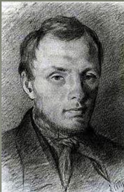
Достоевский в 26 лет, рисунок К. Трутовского, итальянский карандаш, бумага, (1847)