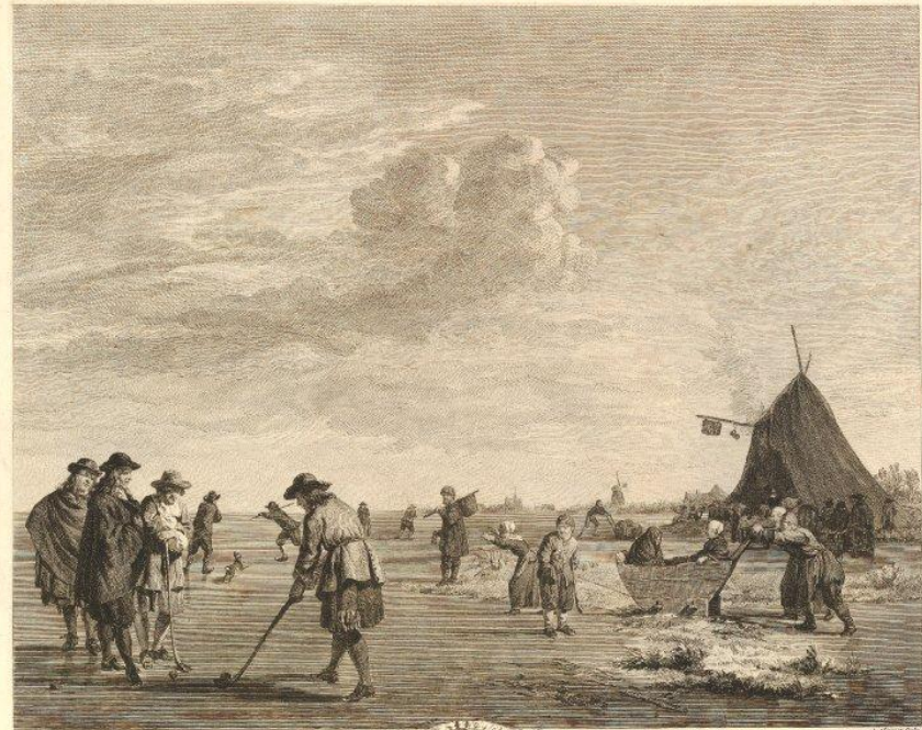
LES AMUSEMENS DÉDIÉ à Messire Louis - Antoine Maréchal de Camp des Armées du Roy, Général d'Empire & D'Autriche à Paris, chez l'Artiste, Paris. DE L'HIVER De la Roche, Marquis de Rumburc, Par son très-humble & très-avaçant serviteur Alouët, Du Cabinet de M r Marotte, à Paris, chez l'Artiste, Paris.