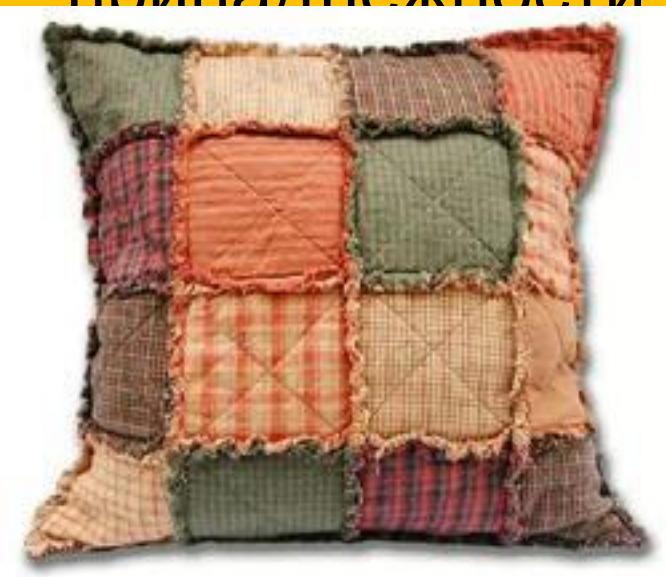
Подушка в технике "Пэчворк"