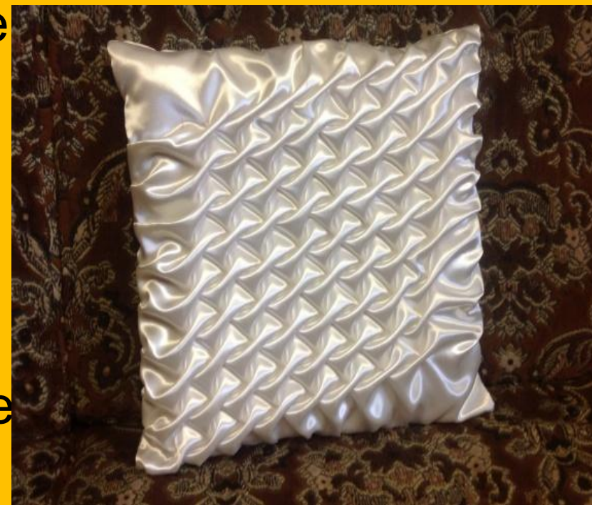
Подушка в технике "Буфы"