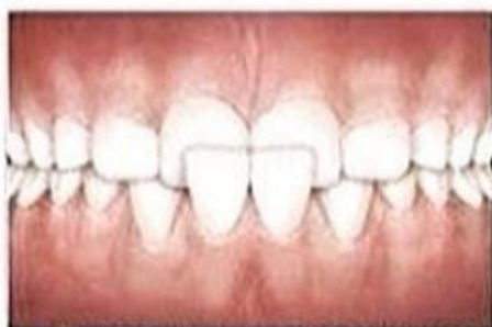
Перекрестный прикус (верхние зубы)