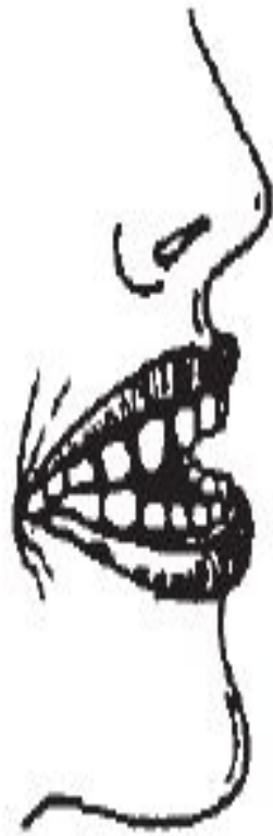
Рис. 1. Открытый передний прикус

механическую (органическую) и функциональную.