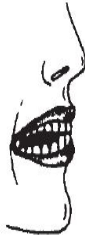
Рис. 2. Открытый боковой прикус