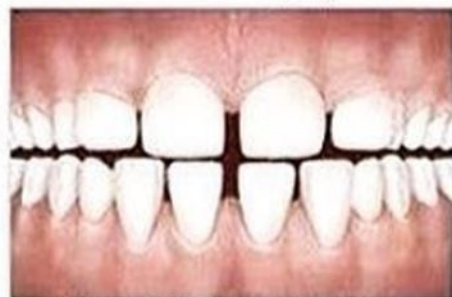
Большое расстояние между зубами

Если возраст Вашего ребёнка от 6 до 8 лет, и Вы заметили у него одно из этих нарушений, обратитесь к врачу!