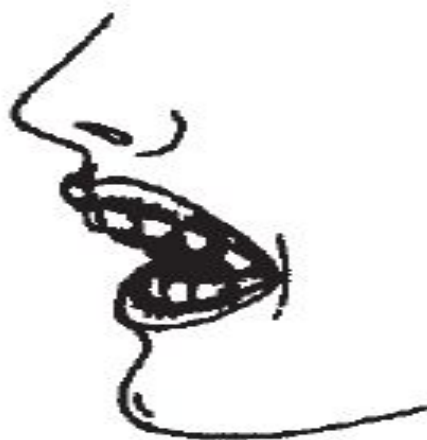
Рис. 3. Прогнатия

Полиморфная: дефект распространяется на 2 и более артикуляционные группы.