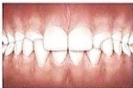
Перекрестный прикус (нижние зубы)