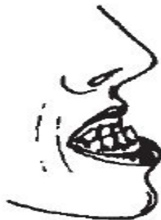
Рис. 4. Прогения