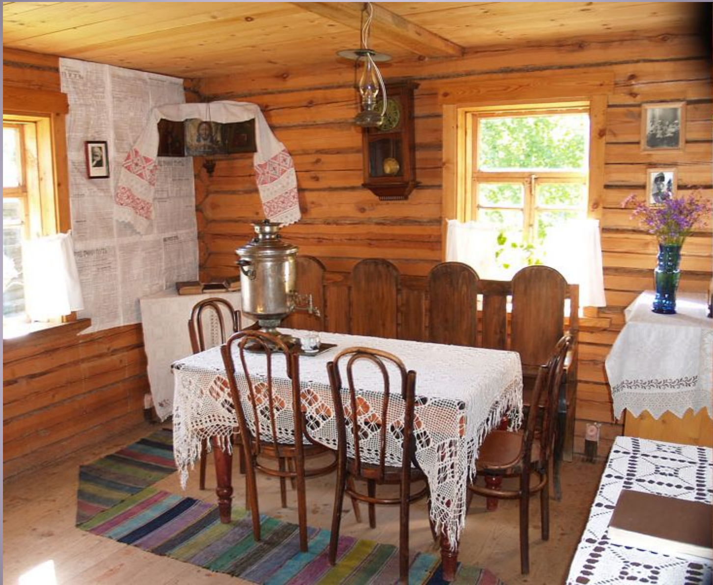
Хутор Загорье - музей-усадыба А.Т. Твардовского.