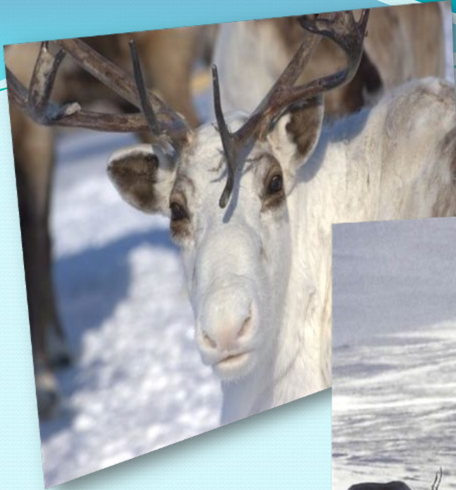
Самка оленя зимой с рогами