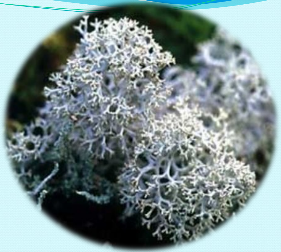
Мох – ягель