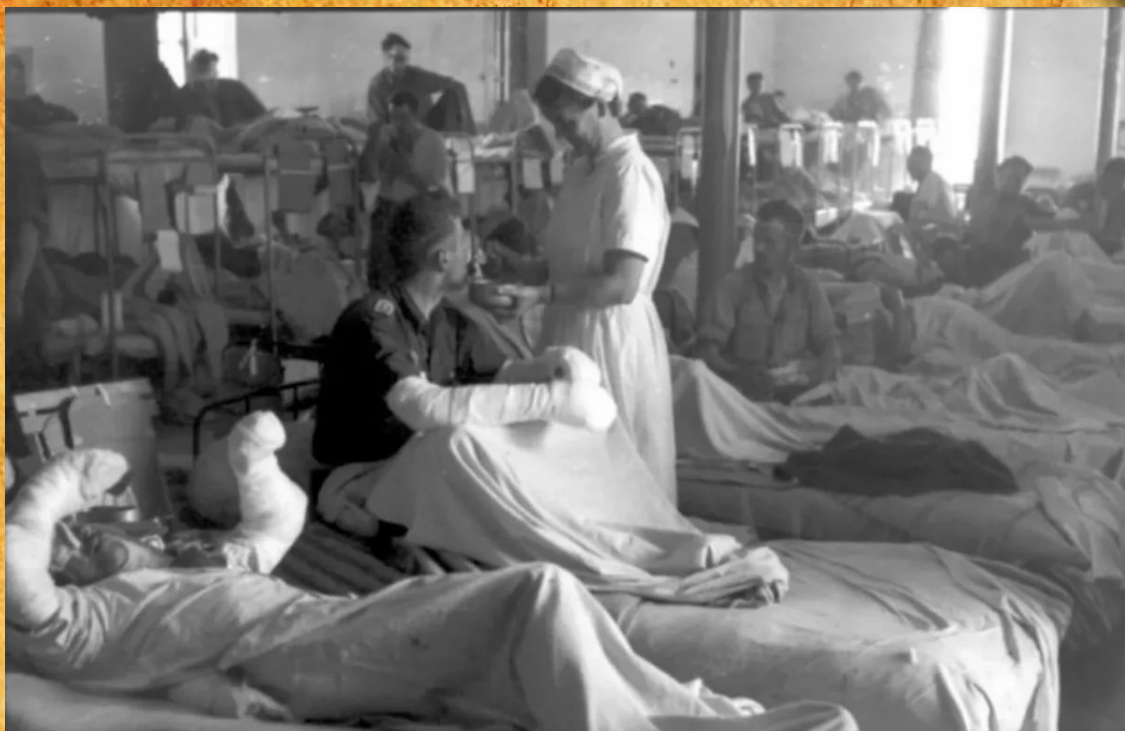
1943 April - Mai

С 25 января 1943 года по март 1943 года находился в госпитале г. Вельск Саратовской области.