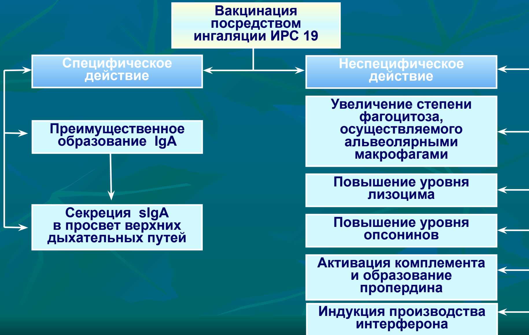
Схема действия местной иммунизации ИРС19