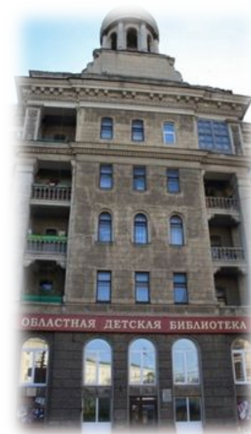
ГУК ТО "Тульская областная детская библиотека"