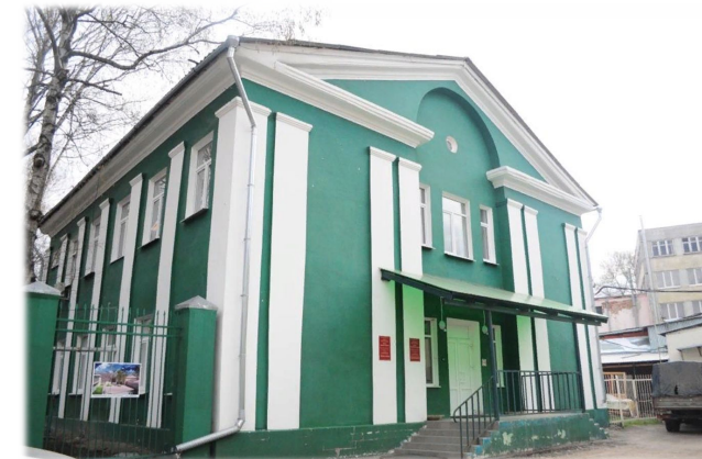
Государственное учреждение культуры Тульской области «Объединение центров развития искусства, народной культуры и туризма»