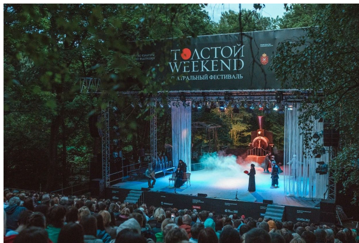
4-7 июля Международный театральный фестиваль в Ясной Поляне. В усадьбе «Ясная Поляна»