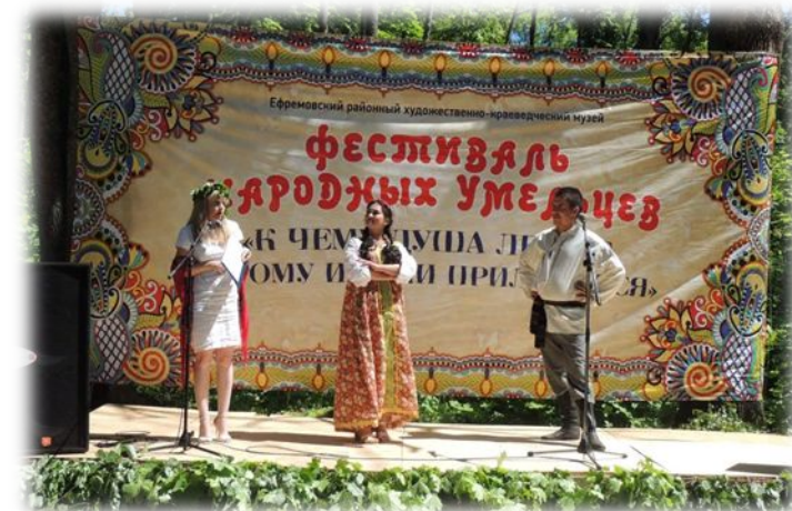
8 июня Фестиваль народных умельцев «К чему душа лежит, к тому и руки приложатся»