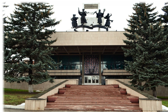
Государственное учреждение культуры Тульской области «Тульский государственный орден Трудового Красного Знамени академический театр драмы имени М. Горького»