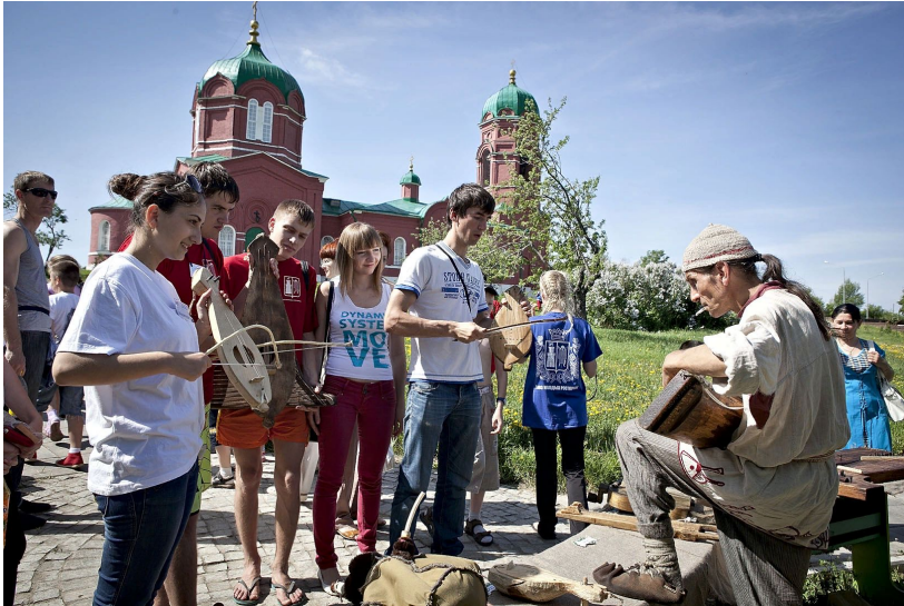
18 мая Фестиваль народных традиций «Былина»