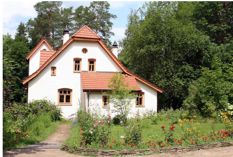
22 июня - 28 июля Летний Международный фестиваль искусств «Век музыке в усадьбе Поленово»