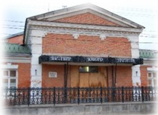
ГУК ТО « Тульский областной театр юного зрителя»