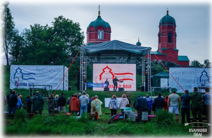
24–26 мая Фестиваль авторской песни «Куликово поле»