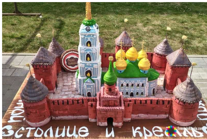
3 августа на территории Тульского кремля самый сладкий фестиваль лета – «День пряника».