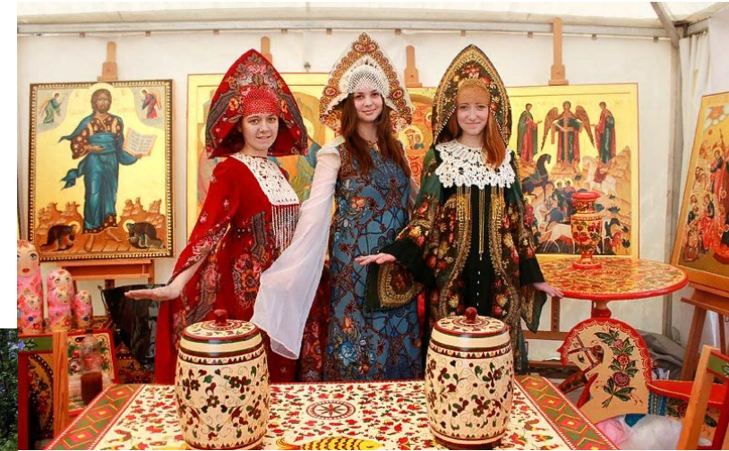
25 мая Межрегиональный фестиваль традиционной народной культуры «Тульский заиграй»