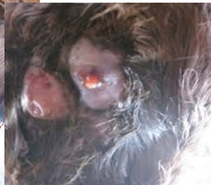
ГНОЙНЫЕ ШИШКИ С ИСТЕКАЮЩИМ ГНОЕМ