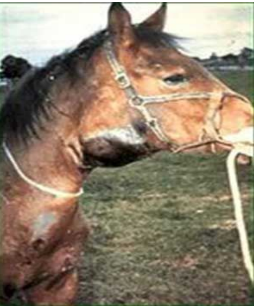
абсцедирование подчелюстных лимфоузлов