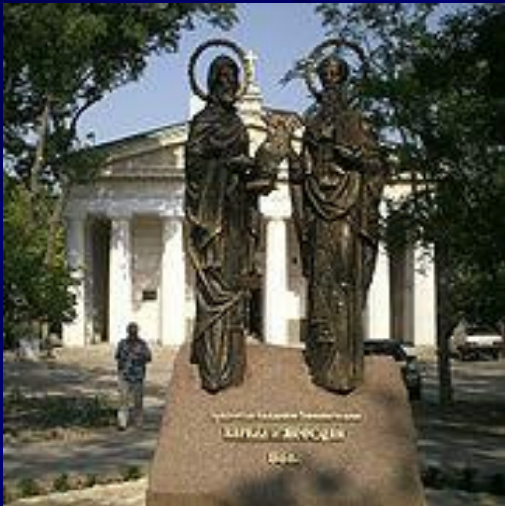
Памятник Кириллу и Мефодию в Севастополе

До пострижения в монахи братьев звали Константин и Михаил. Они были очень образованными людьми. Святые Кирилл и Мефодий своей проповедью много способствовали утверждению христианства в Болгарии, где находились примерно с 850 года. Из Болгарии христианская вера распространилась в соседнюю с ней Сербию.