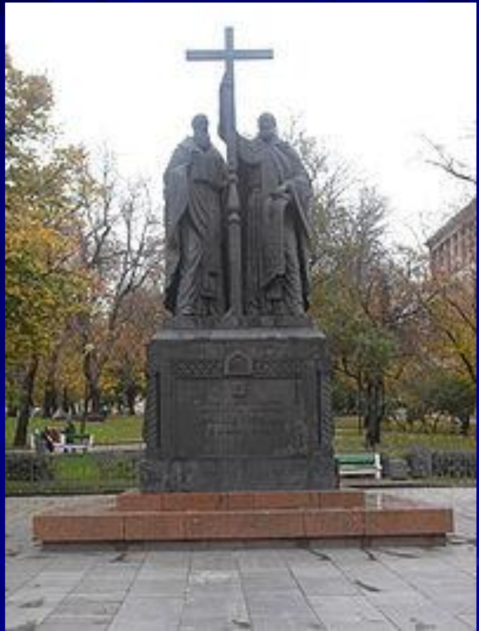
Памятник Кириллу и Мефодию в Москве