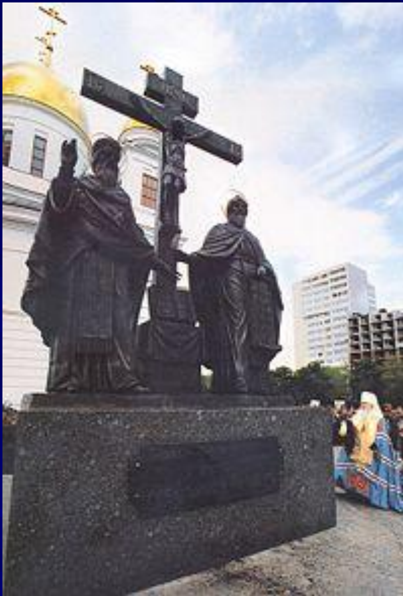
Памятник Кириллу и Мефодию в Самаре