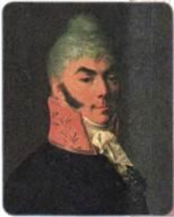
Н. Н. Новосильцев

• Николай Николаевич Новосильцев, талантливый дипломат и государственный деятель, ему Александр поручил разработку конституционного проекта.