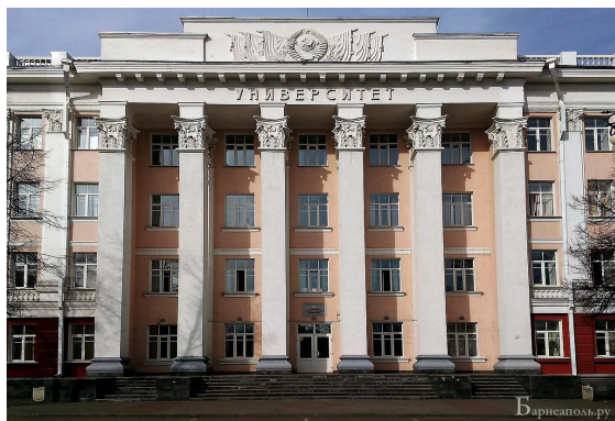
Корпус «Л» (пр. Ленина, 61)