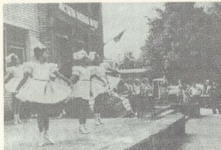
Вучні Прозороцької школи — убзельнікі салточнаго канцэрта. 1981 г.

Празднование 120-летия со дня рождения И. Буйницкого в Прозорках. П. Макаль читает стихи, посвященные И. Буйницкому, 1981 год