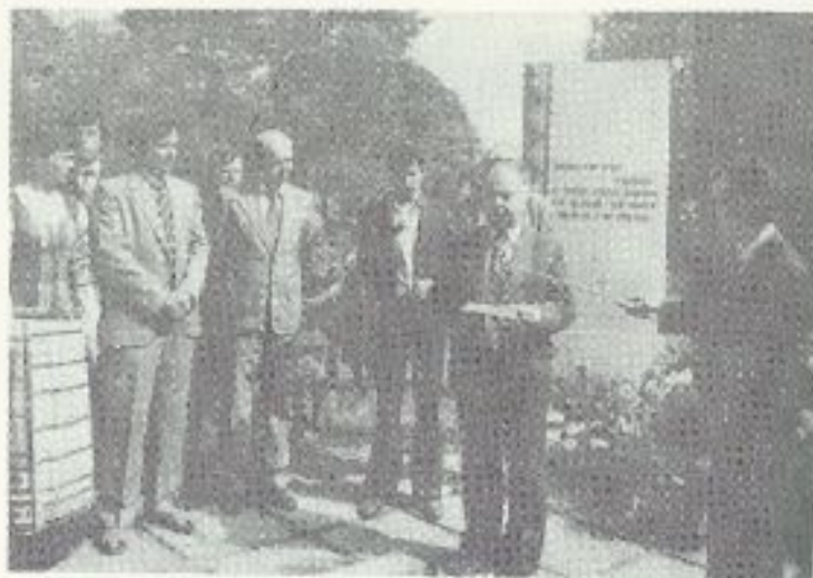
Святкування 120-го дня з дня народження І. Буйницького в Прозорках. П. Макаль читає верши, присвячані І. Буйницькому. 1981 г.

Празднование 120-летия со дня рождения И. Буйницкого в Прозорках. П. Макаль читает стихи, посвященные И. Буйницкому, 1981 год