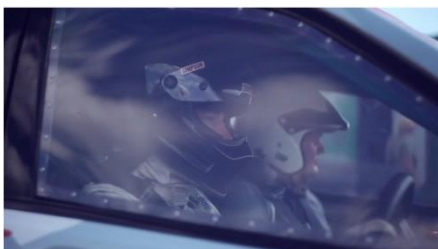
https://vimeo.com/69021414 3 тап RDS/ 2013

Лучше всего атмосферу дрифта передают видео, сделанные настоящими профессионалами, которые с головой погружены в происходящее. Представляем вам подборку самых захватывающих роликов, которые сделали члены нашей команды и наши друзья. Эти ролики имеют большую популярность среди поклонников дрифта, распространяются в Интернете.