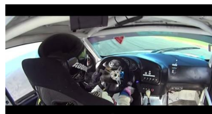
http://www.youtube.com/watch?v=QPW_CYKYpys BMW attack/ 2015