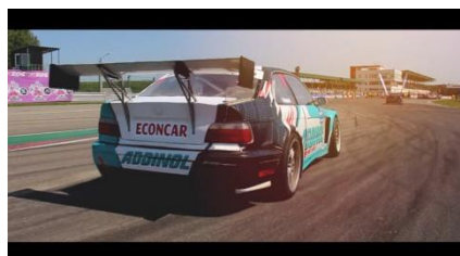
https://vimeo.com/130124189 Этап RDS в Нижнем Новгороде/ 2015