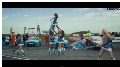
http://www.youtube.com/watch?v=OAZ8hxWw4e Обзор сезона 2014