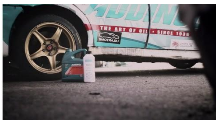
https://vimeo.com/73042848 5 этап RDS/ 2013