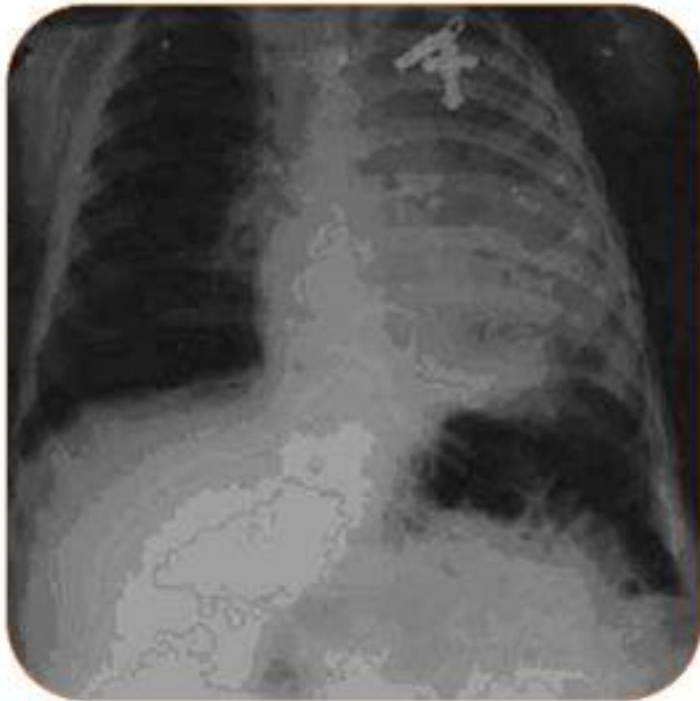
Рис. 1. Рентгенограмма легких ребенка при поступлении в стационар