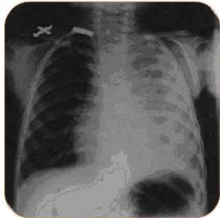
Рис. 2. Рентгенограмма легких через 2 дня

Левосторонняя лobarная пневмония, осложненная левосторонним плащевидным плевритом. Сливная инфильтрация легочной ткани с более интенсивной тенью слева в нижнем медиальном отделе. Второе исследование (через 2 дня) затемнение усилилось – тотальная левосторонняя пневмония, плащевидный плеврит.