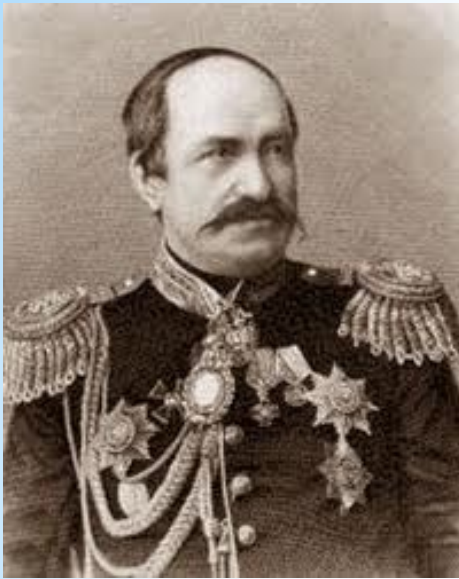
Игнатъев Николай Павлович, министр внутренних дел