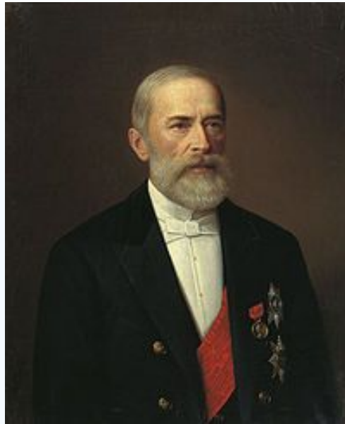
Бунге Николай Христофорович, министр финансов