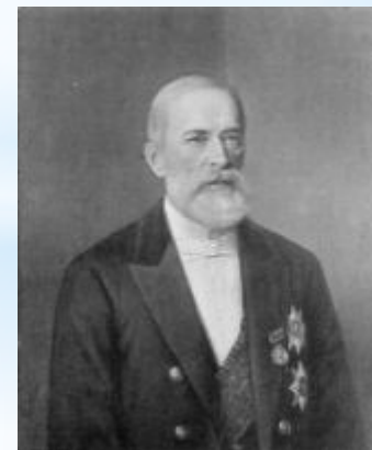
Бунге Н.Х. министр финансов