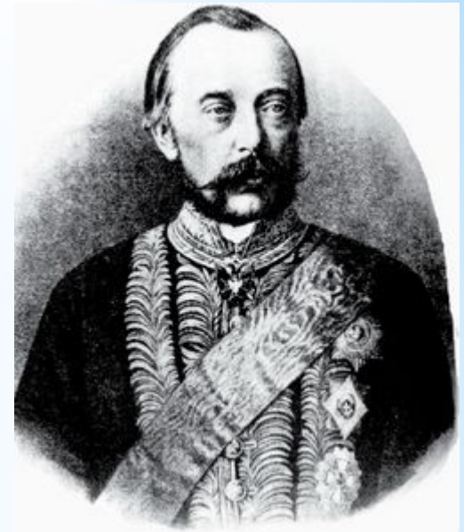
Толстой Дмитрий Андреевич, Министр внутренних дел и шеф жандармов

Внутриполитический курс Александра III выразился в проведении мер, направленных на ограничение реформ 60-70-х гг. и поэтому получивших название "контрреформы" .