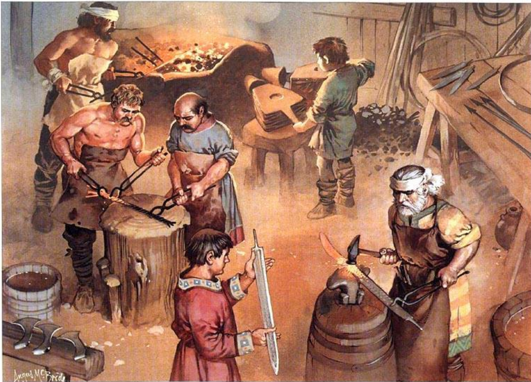
Weapons production, a Frankish workshop, 6th century