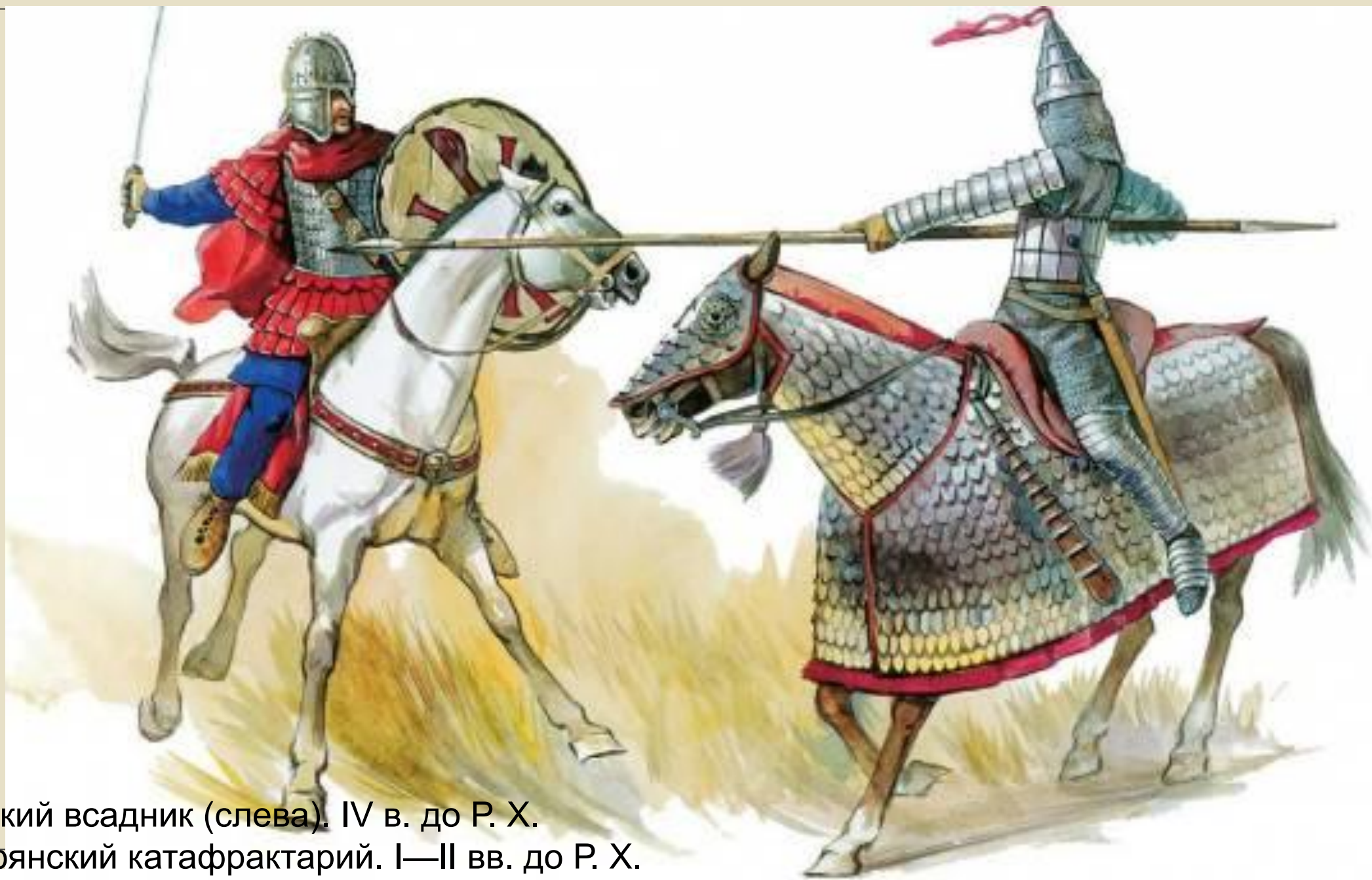
Римский всадник (слева). IV в. до Р. Х. Парфянский катафрактарий. I—II вв. до Р. Х.