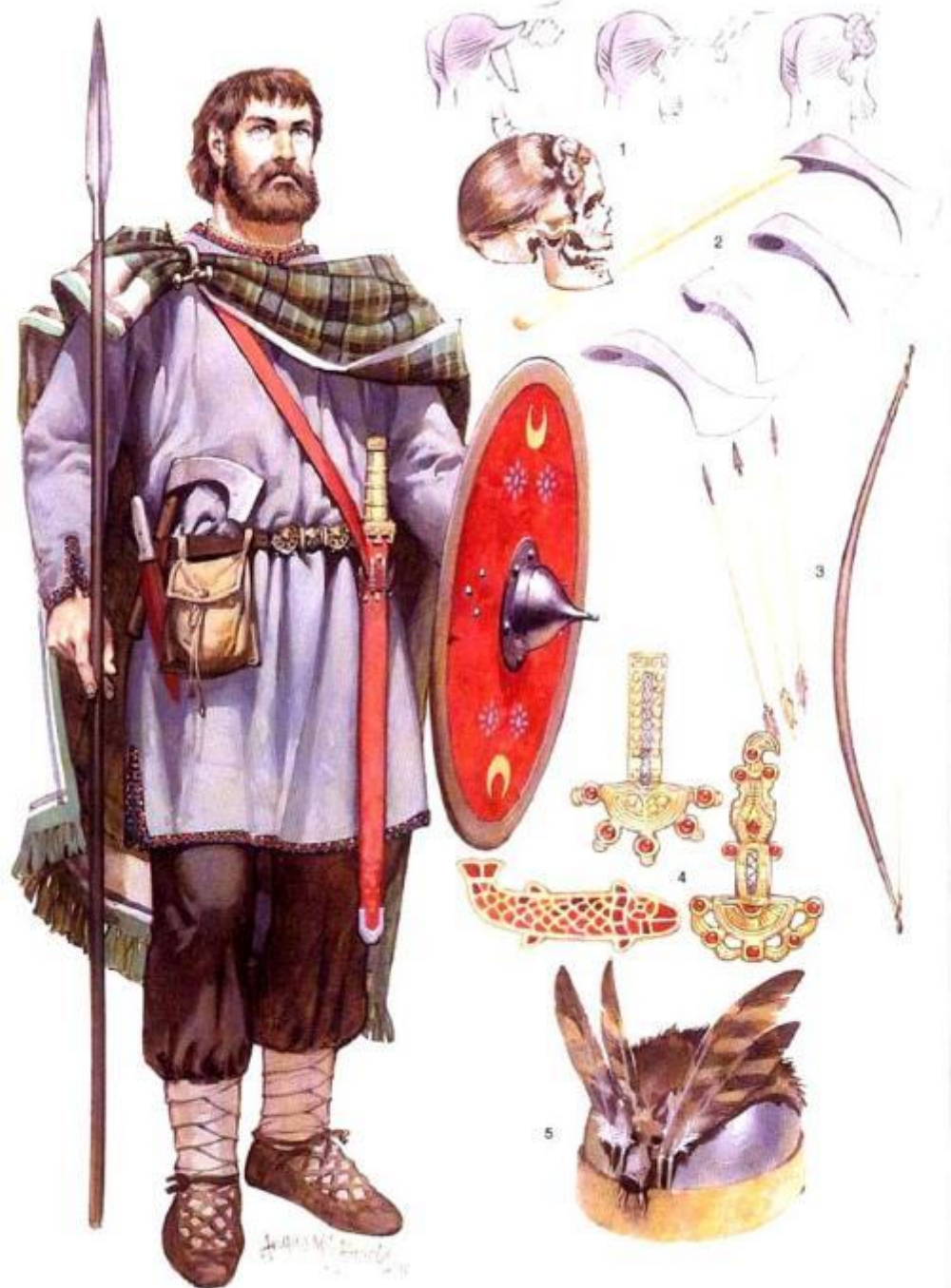
Alamannic warrior, 3rd-4th century AD (See text commentary for detailed captions)

Алеманнский воин (III-IV в.н.э.): 1 - "свевский узел" - традиционная прическа; 2 - франциска - метательный топор; 3 - германский лук; 4 - застёжки и броши; 5 - шлем с перьями.