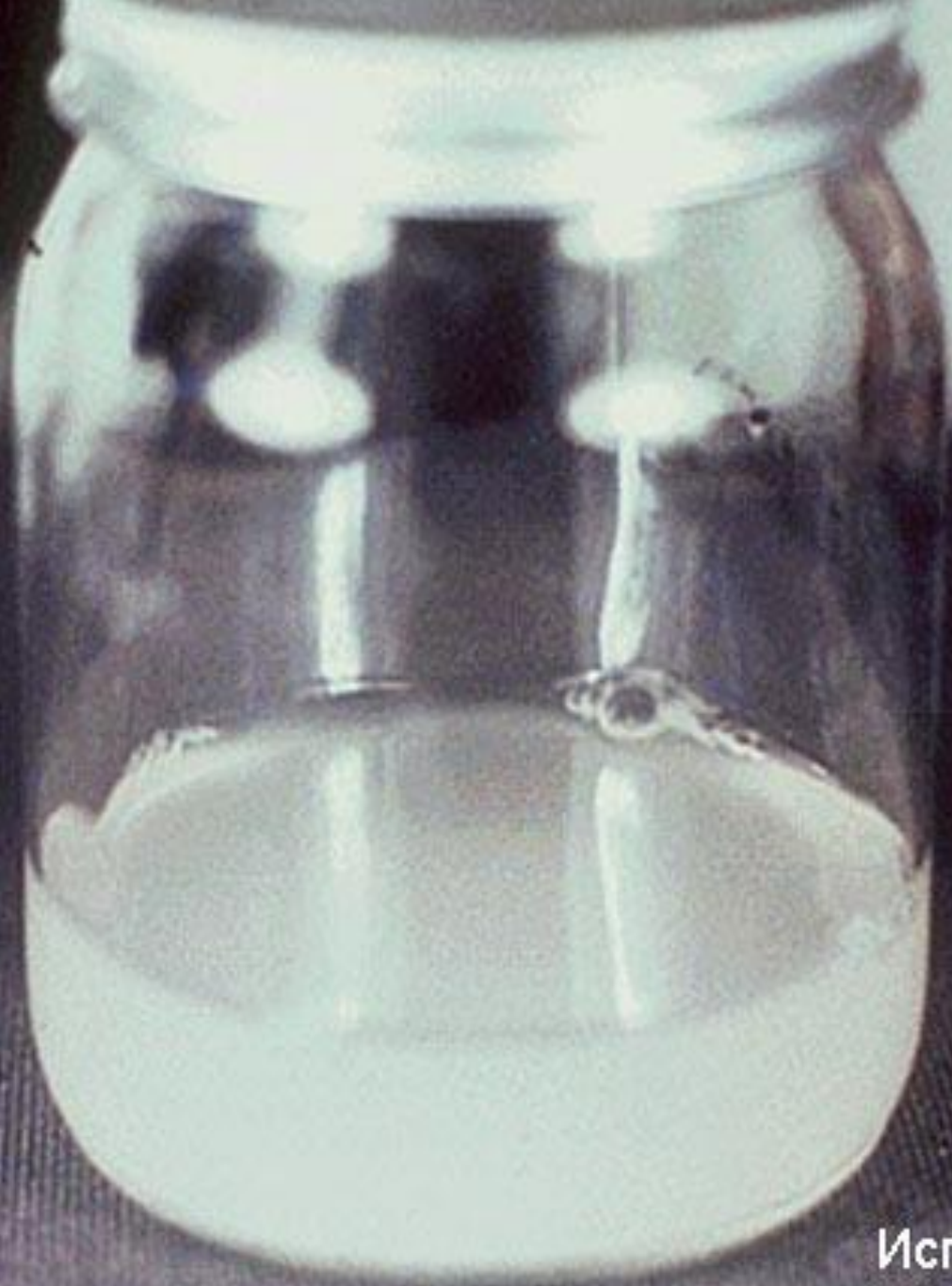
Испражнения в виде “рисового отвара”