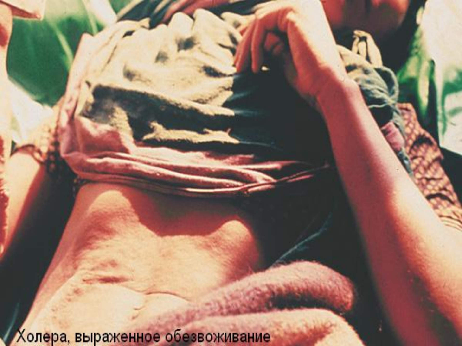
Холера, выраженное обезвоживание