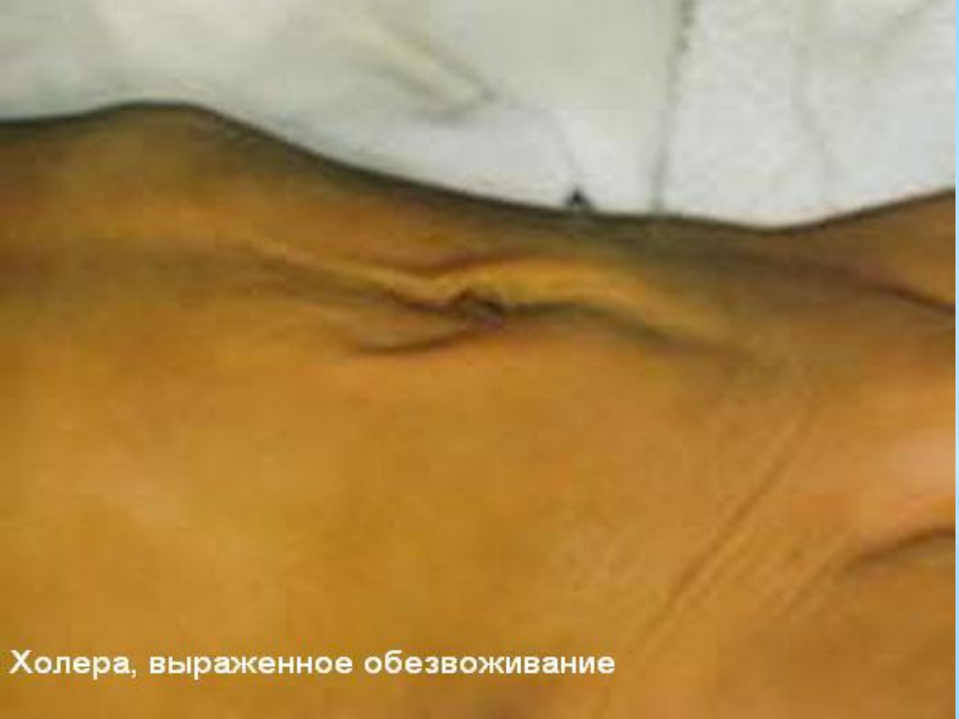
Холера, выраженное обезвоживание