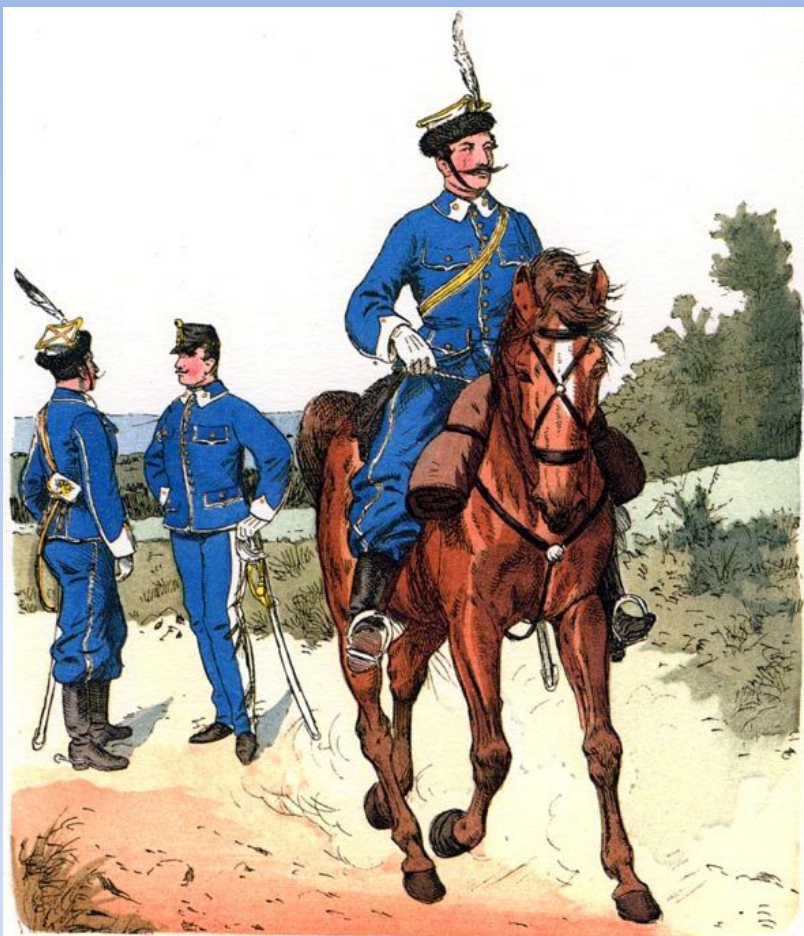
Offizier in Parade. Offizier im Gesellschaftsanzug. Offizier in Parade.