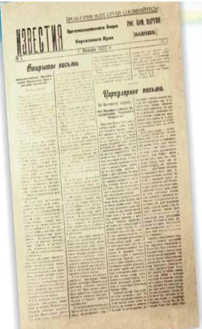
Первый выпуск «КП» вышел 1 января 1920 года под названием «Известия Киргизского края»