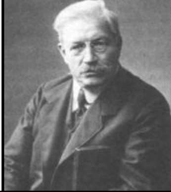
П.Н. Миллюков, кадет