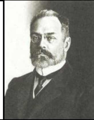
А.И. Гучков, октябрист