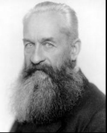
Председатель, министр внутренних дел