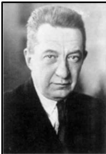
А.Ф. Керенский, эсер