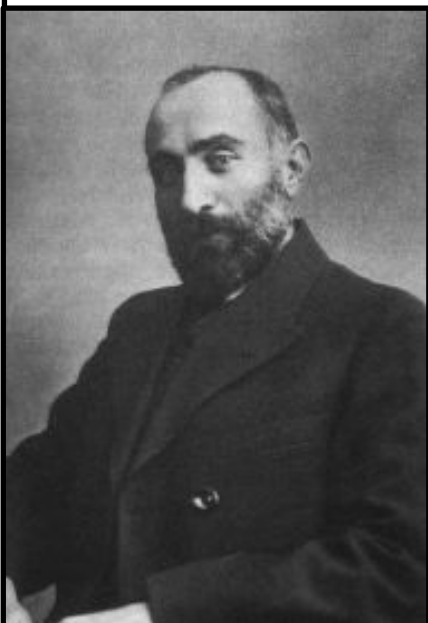
Н.С. Чхеидзе, председатель Исполнительно го комитета, меньшевик