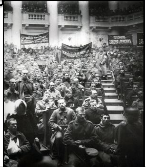
Заседание Совета рабочих и солдатских депутатов в Таврическом дворце