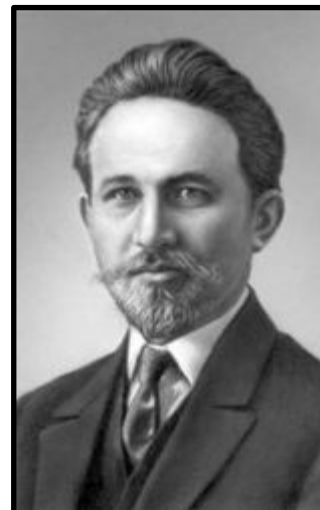
М.И. Скобелев, меньшевик