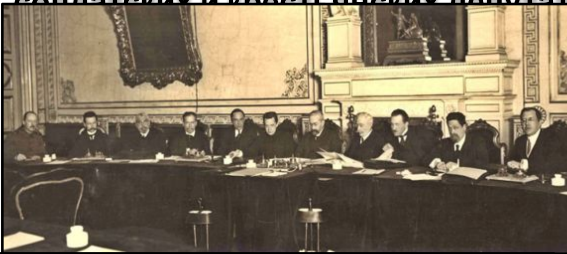
Заседание Временного правительства в Мариинском дворце