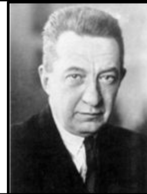
А.Ф. Керенский, эсер