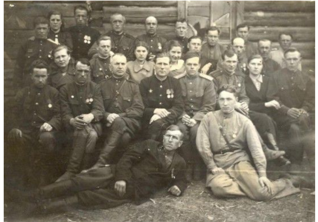
Личный состав Добрушской милиции. 1946 год.

Особенно ярко проявились высокие профессиональные и личностные качества сотрудников милиции в период Великой Отечественной войны. Великая Отечественная война началась ранним утром 22 июня 1941 года. Это была самая тяжелая из всех войн, которые пришлось пережить народу нашей страны. Милиция Беларуси была переведена на военное положение и полностью подчинена задаче обороны страны и разгрома врага. Она вела решительную борьбу с нарушителями правопорядка, дезертирами, мародерами, паникерами, очищала города и оборонно-хозяйственные пункты от преступных элементов, выявляла вражеских агентов и провокаторов, поддерживала организованную эвакуацию населения, промышленных предприятий, других хозяйственных грузов в глубь страны. В Беларуси, на территории которой с первых дней войны развертывался основной театр боевых действий, перед работниками милиции вставали и дополнительные, особые обязанности. Им первым приходилось сталкиваться непосредственно с фашистскими парашютистами, десантными группами противника, действовать в боевой обстановке.