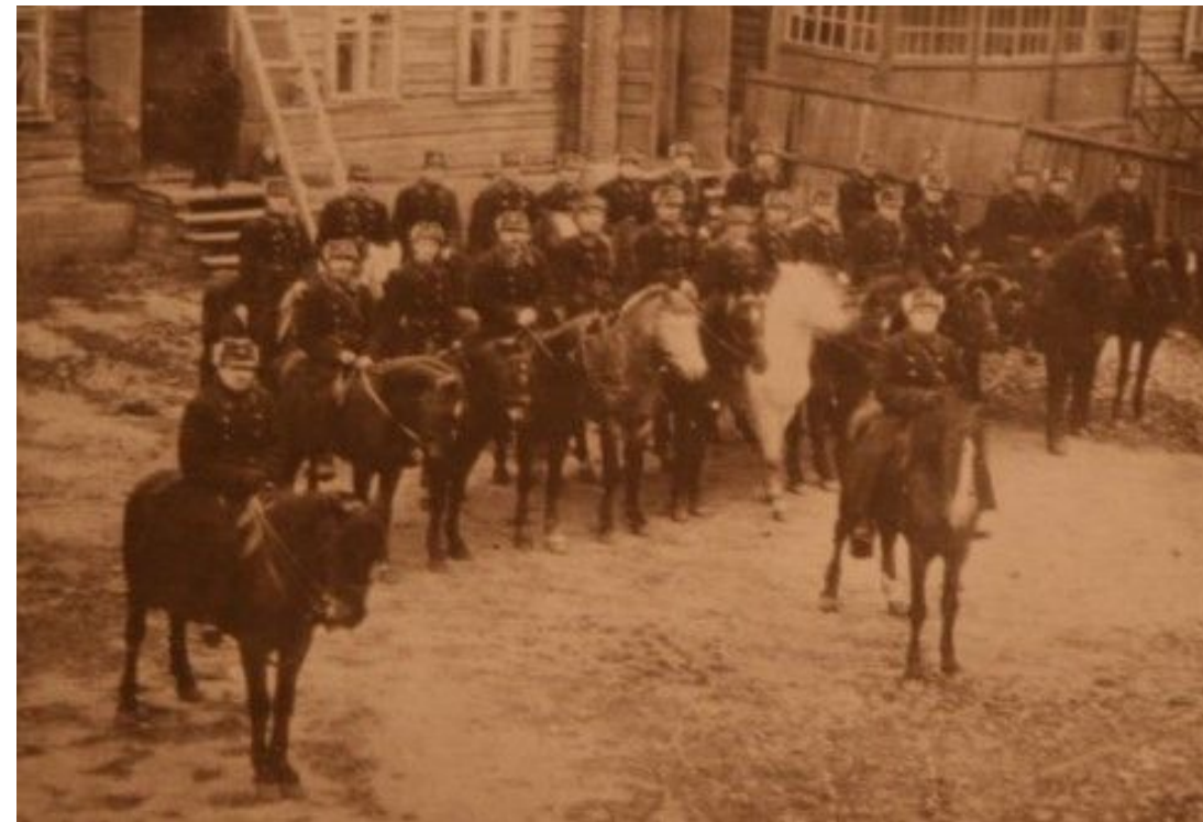
Начальствующий состав Невельской милиции. 1925 год.

Начало переходу к новому этапу организационного строительства – централизованному управлению деятельностью органов милиции и уголовного розыска в масштабе СССР – положило принятие ЦИК и СНК СССР постановления от 15 декабря 1930 года «О ликвидации народных комиссариатов внутренних дел союзных и автономных республик». С ликвидацией НКВД союзных и автономных республик создавалась самостоятельная централизованная система органов по борьбе с преступностью, охране общественной безопасности и революционного порядка. С введением общесоюзного положения центральным органом в республике стало Главное управление милиции при Совете Народных Комиссаров БССР, а местными органами – городские и районные управления милиции. На Главное управление милиции возлагались организация и руководство повседневной деятельностью рабоче-крестьянской милиции, определение места ее дислокации, структуры и штатов с последующим утверждением их СНК. В сентябре 1931 года Совнаркомом республики было утверждено положение о Главном управлении рабоче-крестьянской милиции при СНК БССР.