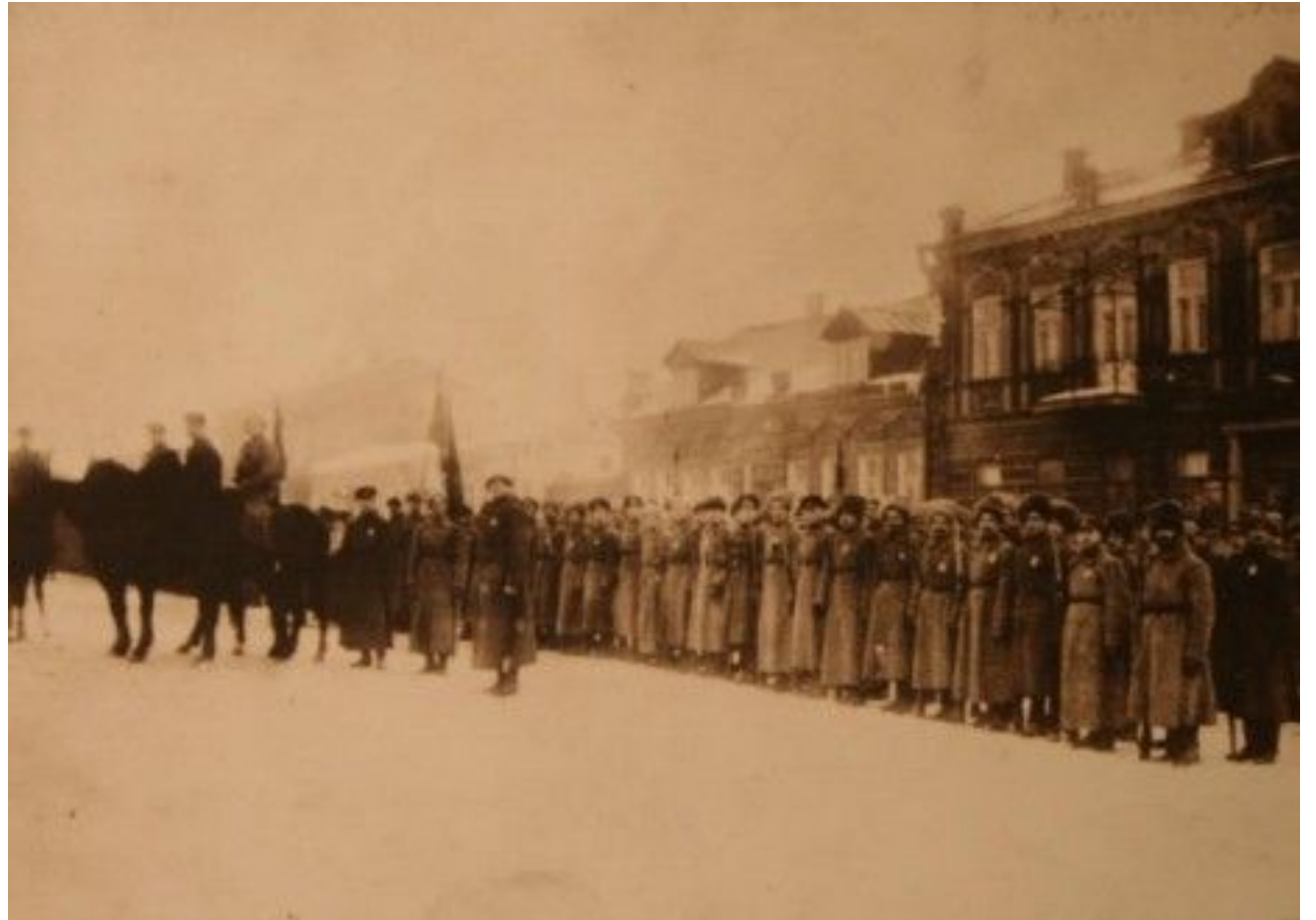
Парад работников милиции и частей Красной Армии Витебского гарнизона в день празднования годовщины Красной Армии. 1919 год.

Милиция, будучи частью единого государственного механизма, не могла быть в стороне от решения главной задачи – разгрома иностранных интервентов и так называемой внутренней контрреволюции. Поэтому наряду с охраной общественного порядка, борьбой с преступностью на милицию возлагался ряд задач по обороне молодой республики, участию в боевых действиях против оккупантов.