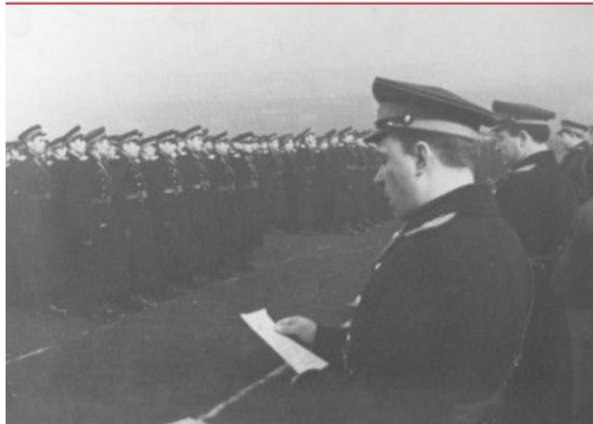
Торжественная Присяга сотрудников Минского гарнизона милиции. 1962 год.

Повсеместно организовывалось проведение торжественных ритуалов принятия личным составом присяги на верность социалистической Родине и Советскому правительству. Указом Президиума Верховного Совета СССР от 26 сентября 1962 года устанавливается День Советской милиции, который ежегодно отмечается 10 ноября.