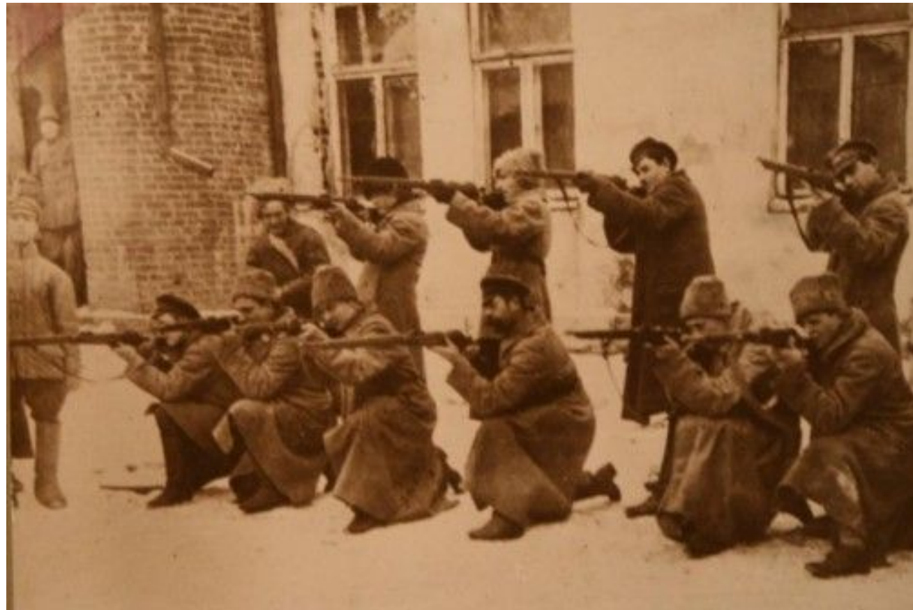
Стрелковые занятия милиционеров. Гомель. 1921 год.

Основные функции органов внутренних дел неоднократно претерпевали изменения, уточнялись и постепенно стабилизировались. Была выработана единая сверху донизу структура как системы в целом, так и отдельных служб и органов в частности, что позволило 30 ноября 1920 года разработать первое Положение о Главном управлении милиции БССР. В марте 1924 года произошло расширение территории республики. К ней отошли входившие в РСФСР 15 уездов и ряд волостей Витебской, Смоленской и Гомельской губерний, населенных преимущественно белорусами. Состоявшаяся 10–17 июля 1924 года вторая сессия ЦИК БССР VI созыва законодательно закрепила новое административно-территориальное деление республики, в результате которого в Беларуси было создано 10 окружных управлений милиции и уголовного розыска, 100 районных и 12 городских отделений милиции.