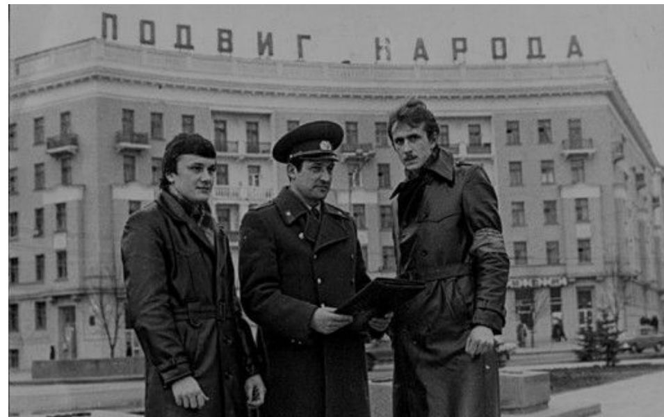
Участковый инспектор милиции с дружинниками на Площади Победы в городе Минске. 1985 год.

В феврале 1991 года Верховный Совет БССР принял, а с 1 марта этого же года ввел в действие Закон «О милиции» – основной нормативно-правовой акт, регламентирующий деятельность органов внутренних дел республики. В соответствии с Законом «О некоторых изменениях в системе органов государственного управления Белорусской ССР» Министерство внутренних дел БССР преобразовывалось из союзно-республиканского в республиканское и ему были переподчинены все органы внутренних дел СССР на территории Беларуси. Вслед за этим Президиум Верховного Совета Республики Беларусь утвердил текст Присяги рядового и начальствующего состава и положение о порядке ее принятия, Дисциплинарный устав органов внутренних дел.