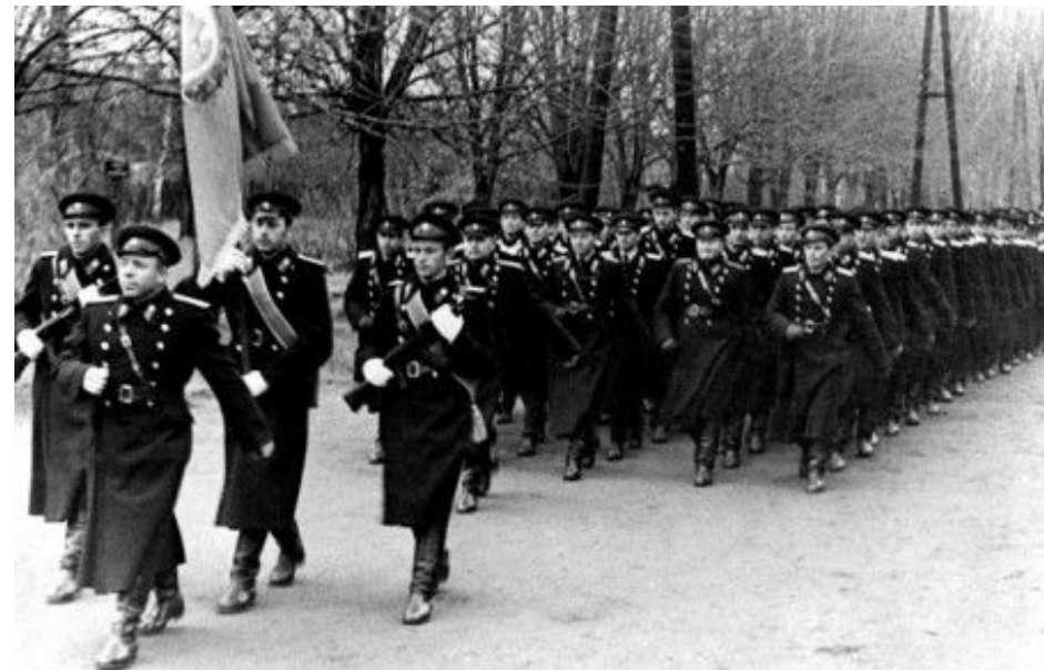
Торжественный марш курсантов Могилевской средней специальной школы транспортной милиции. 1963 год.

Одним из важнейших изменений в организации органов внутренних дел было преобразование, в соответствии с Указом Президиума Верховного Совета БССР от 9 декабря 1968 года, МООП БССР в Министерство внутренних дел Белорусской ССР, а областных УООП – в управления внутренних дел соответствующих исполкомов областных Советов депутатов трудящихся. Эта реорганизация привела содержание и структуру ведомства в соответствие с поставленными перед ним задачами. На середину 80-х пришлись времена общественно-политической и экономической дестабилизации жизни страны. Эти явления сопровождалось обострением криминальной обстановки, а значит и существенным увеличением нагрузки на сотрудников органов внутренних дел. В то же время ОВД велась большая работа по совершенствованию системы реагирования на заявления и сообщения о преступлениях, улучшению их предупреждения и раскрытия. Совершенствовалась система патрульно-постовой службы, принимались меры по укреплению общественного порядка на улицах, в других местах массового пребывания людей, повышению организованности дорожного движения и усилению воспитательной работы с водителями в автохозяевах, активизации борьбы с пьянством и