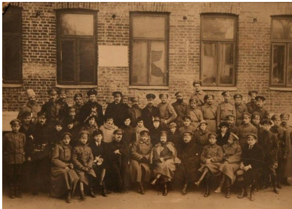
Группа работников штаба Минского городской милиции. Октябрь 1917 года

Новая милиция в конце 1917 – начале 1918 года в Беларуси съездах Советов рабочих, солдатских и крестьянских депутатов наряду с другими решались вопросы создания новой милиции как органа охраны революционного порядка и вооруженной силы Советов. 16 мая 1918 года коллегия НКВД приняла следующее решение: милиция существует как постоянный штат лиц, исполняющий специальные функции; организация милиции должна осуществляться независимо от организации Красной Армии, функции их должны быть строго разграничены.