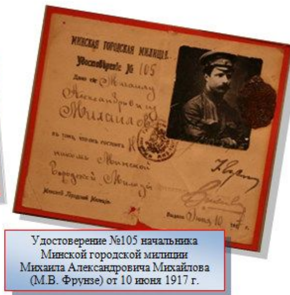
Удостоверение №105 начальника Минской городской милиции Михаила Александровича Михайлова (М.В. Фрунзе) от 10 июня 1917 г.