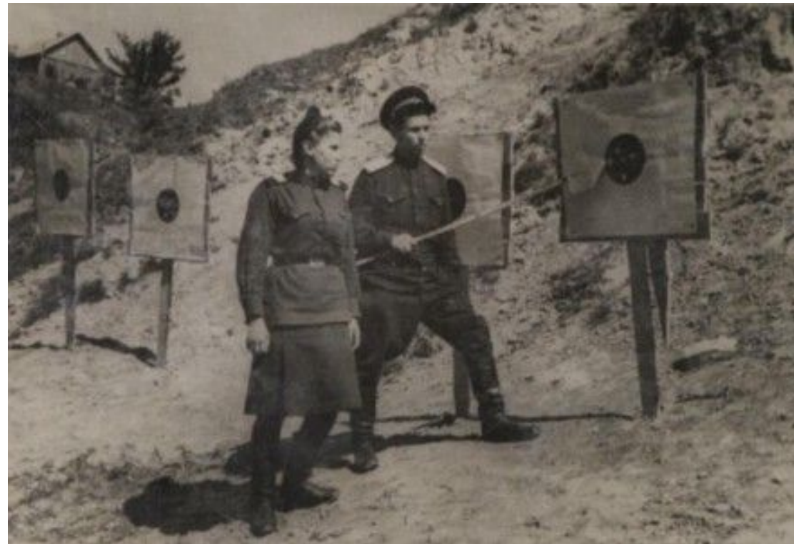
Учебный сбор сотрудников управление милиции МГБ Витебской области. 1950 год.

Нелегким выдалось начало 50-х. Особенно напряженным для сотрудников белорусской милиции, как впрочем, и для их коллег из других советских республик, стал 1953 год – год памятной амнистии. Имелось немало фактов, когда матерые преступники, попавшие под амнистию, активно втягивали в противозаконную деятельность и подростков. Оперативная обстановка в республике стабилизировалась лишь через два года. Смерть И. В. Сталина в марте 1953 года существенно изменила развитие Советского государства, в том числе и правоохранительной системы. Уже 5 марта 1953 года на совместном заседании Пленума ЦК КПСС, Совета Министров СССР и Президиума Верховного Совета СССР принято решение об объединении МГБ СССР и МВД СССР в одно министерство – МВД СССР. Существенные изменения претерпела структура милиции. Так, согласно Указу Президиума Верховного Совета БССР от 19 мая 1954 года из системы МВД в очередной раз были выделены и организационно оформлены органы государственной безопасности. Милиция заняла свое исторически и функционально обусловленное место в системе правоохранительных органов. К 60-70-ым годам органы внутренних дел Беларуси по эффективности деятельности уже назывались лучшими в системе МВД Союза ССР, служили базой для показа коллегам из различных регионов СССР передовых форм и методов работы. Широкий размах получила всенародная поддержка деятельности белорусской милиции — из года в год увеличивались ряды народных дружинников, совершенствовалась система общественных пунктов охраны