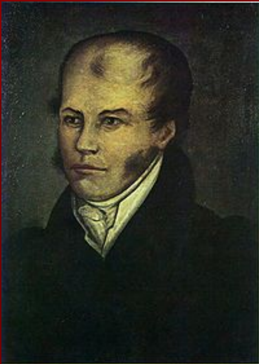
Іван Павлович Менделєєв — батько Д. І. Менделєєва.