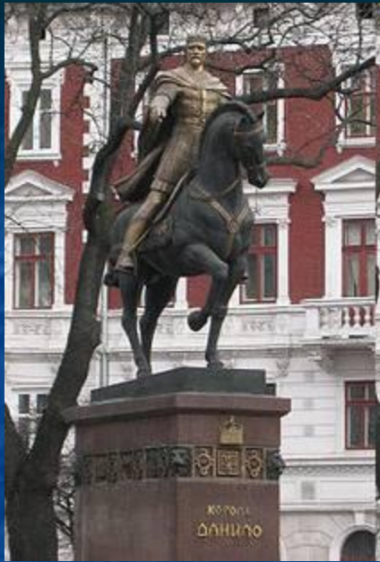
Пам'ятник Данилу Галицькому у Львові

1245 р. - ...О, лихіша від лиха честе татарська! Данило Романович, що був князем великим, володів із братом, своїм Руською землею, Києвом, і Володимиром, і Галичем, і іншими краями, нині сидить на колінах і холопом себе називає!