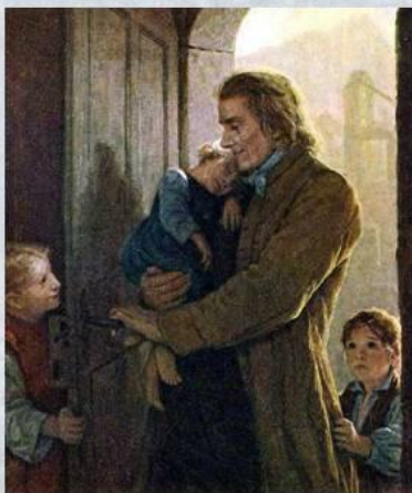
Иоганн Генрих Песталоцци 1746 – 1827