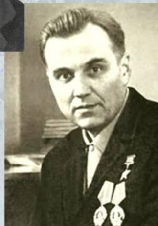
В.А. Сухомлинский 1918 – 1970