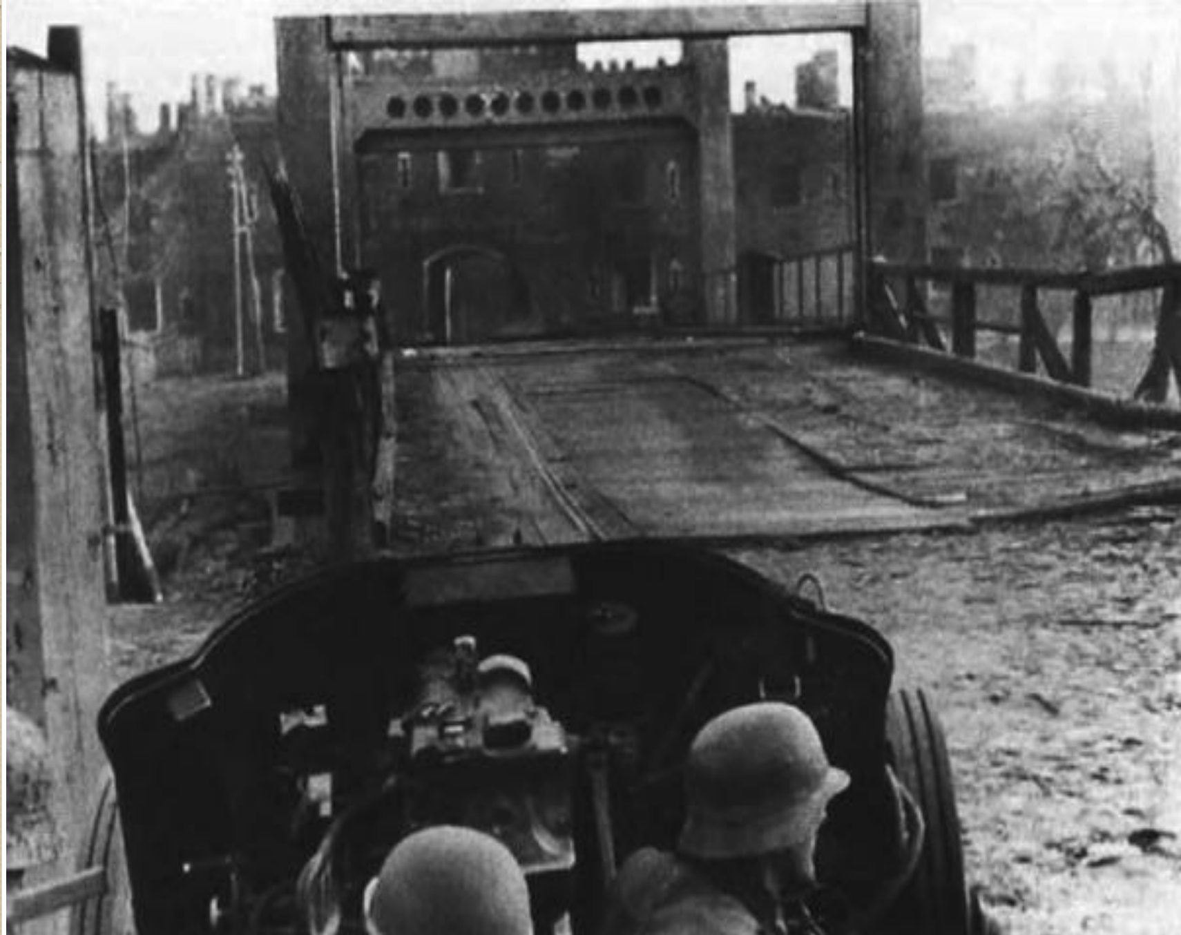
50-мм противотанковое орудие PaK-38 на фоне Холмских ворот.