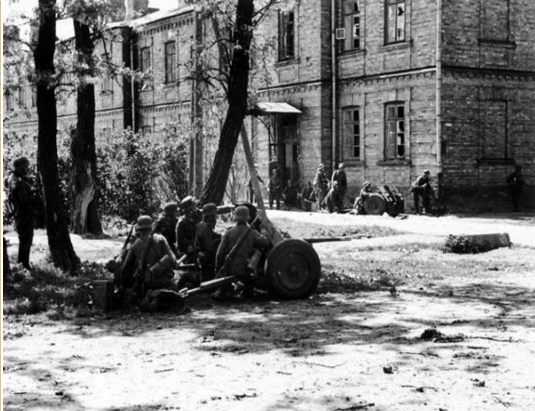
Немцы на улицах Бреста. У стены здания – 75-мм легкое пехотное орудие le.I.G.18, на переднем плане 37-мм противотанковая пушка PaK-35/36.