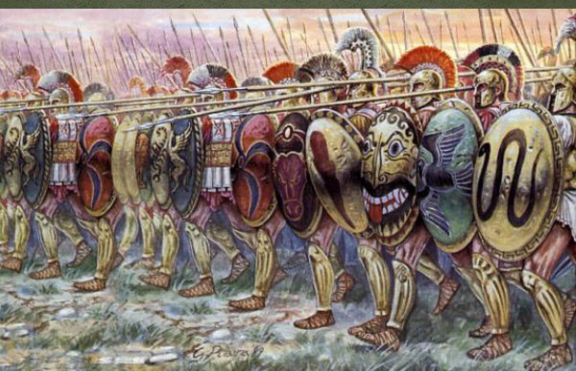
Греческая фаланга в нач. V в. до н. э.