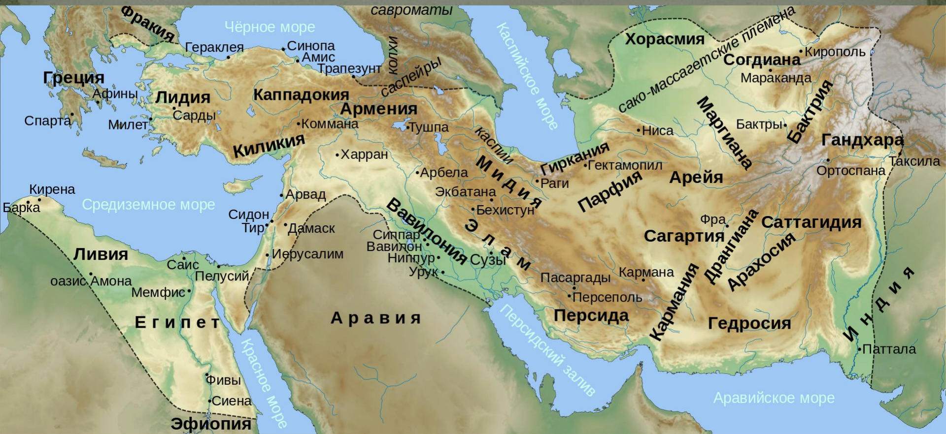
Персидская держава в нач. V в. до н. э.