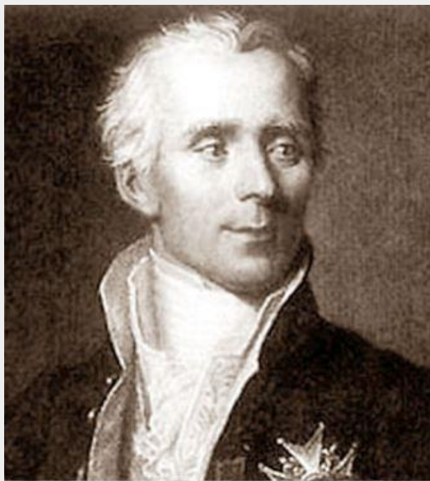
Пьер Симон Лаплас