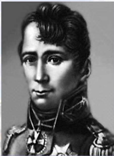
Иван Федорович Крузенштерн

русский мореплаватель, организатор и руководитель первой русской кругосветной экспедиции