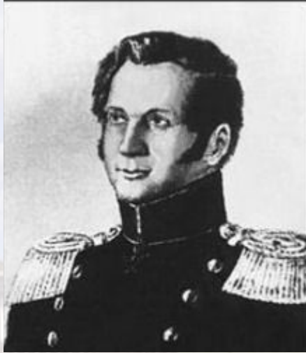
Павел Петрович Аносов

русский химик, раскрыл секрет дамасской булатной стали и наладил производство булатных клинков для холодного оружия; внедрил способ получения золота из золотосодержащих песков путем плавления в доменных