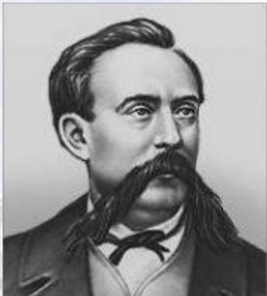
Николай Николаевич Зинин