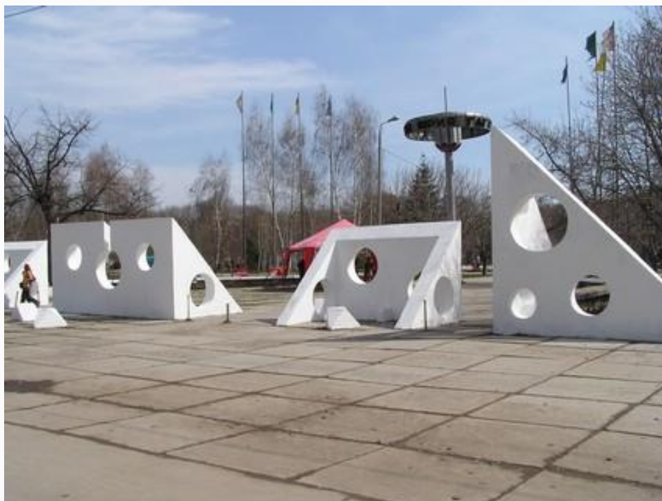
Парк им. Ю. Гагарина в Самаре

Во многих городах России и в городах других стран существуют улицы названные именем космонавта, проспекты, площади, бульвары, парки, клубы и школы имени Гагарина.