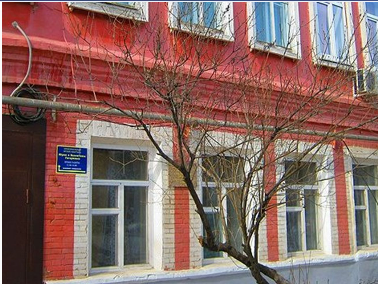
Мемориальный музей-квартира Юрия и Валентины Гагариных в городе Оренбурге.