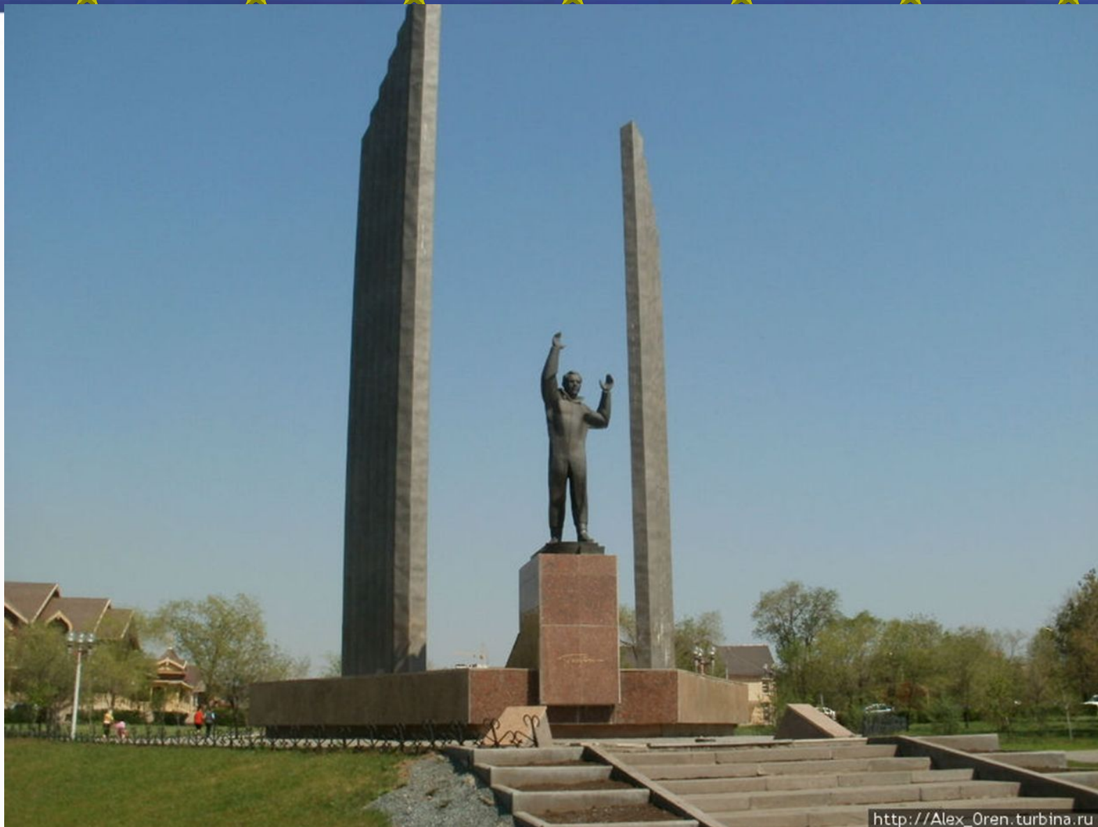
Памятник Юрию Алексеевичу Гагарину на проспекте Гагарина в городе Оренбурге.