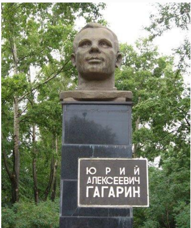
Памятник Ю. Гагарину в Москве