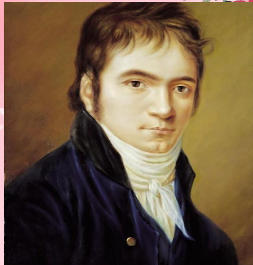
Людвиг Ван Бетховен