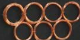
Прокат стальной Ø 2,20-5,5 мм