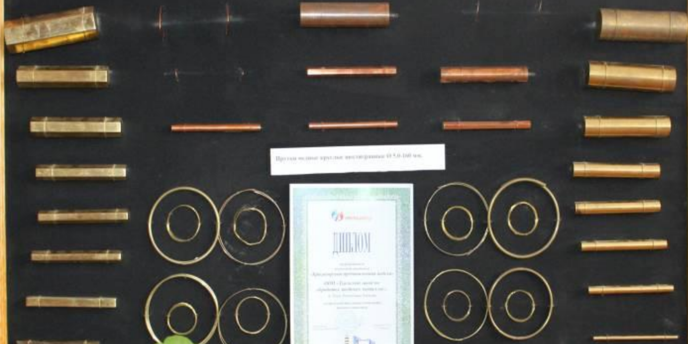
Прокатные круглые заготовки Ø 5,6-100 мм