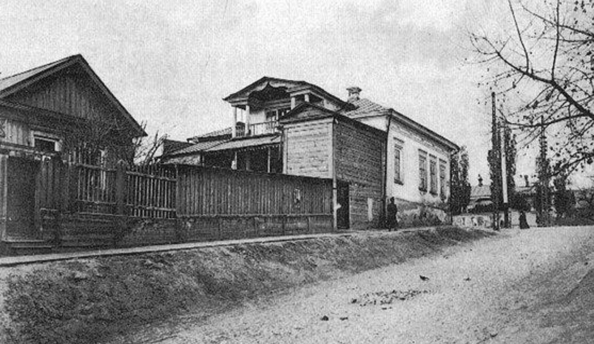
Дом-музей Н.Г.Чернышевского в Саратове