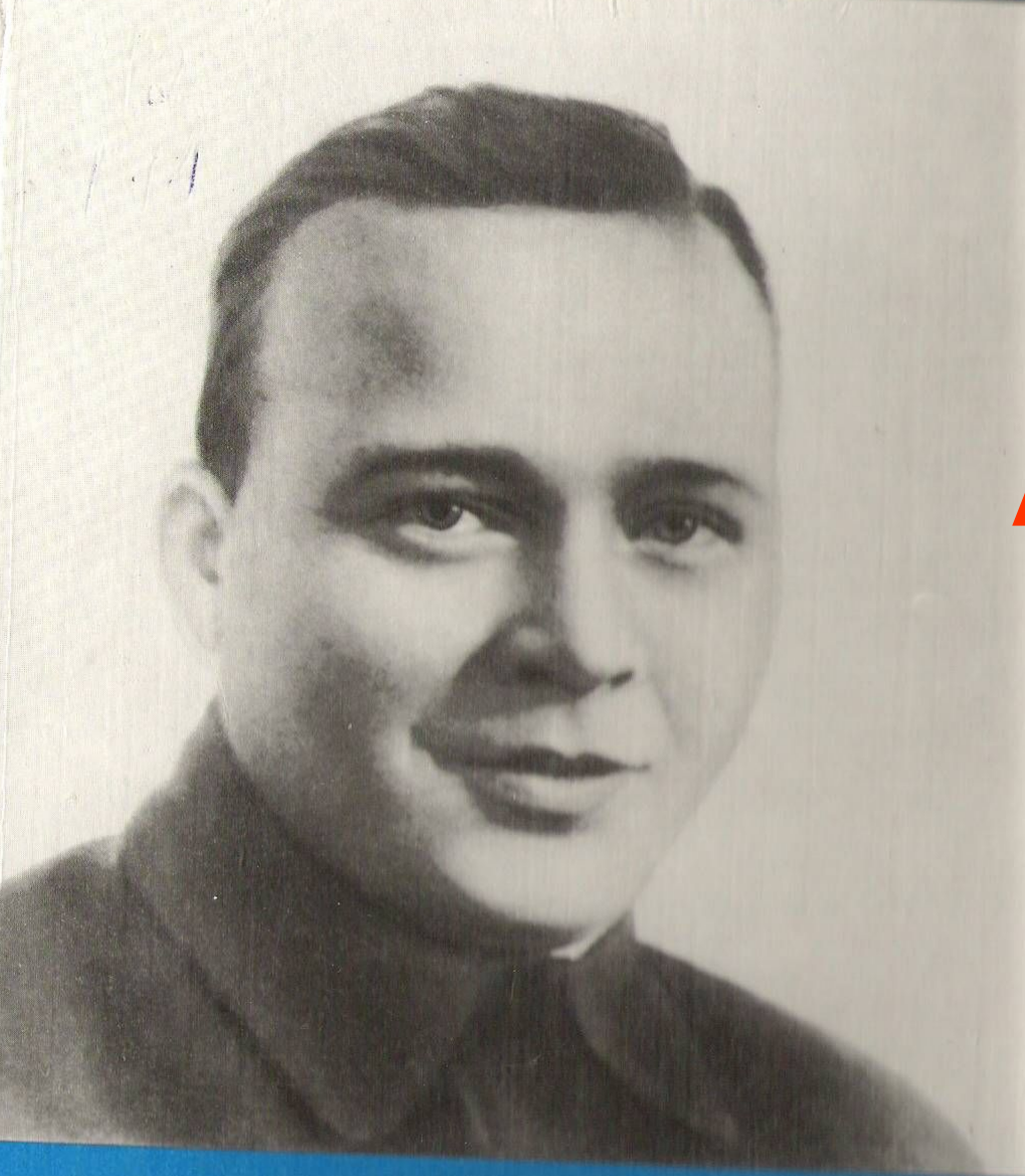
АРКАДИЙ ПЕТРОВИЧ ГОЛИКОВ ГАЙДАР (1904 – 1941)