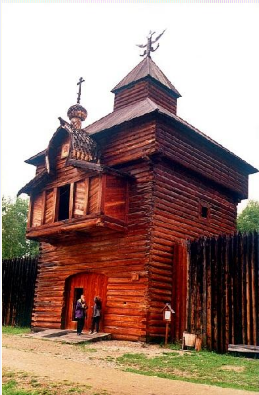
Спасская проезжая башня