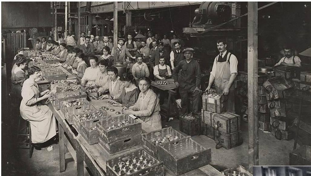
Германия 1916 год