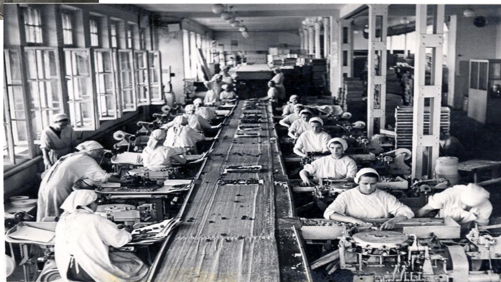
Россия 1918 год