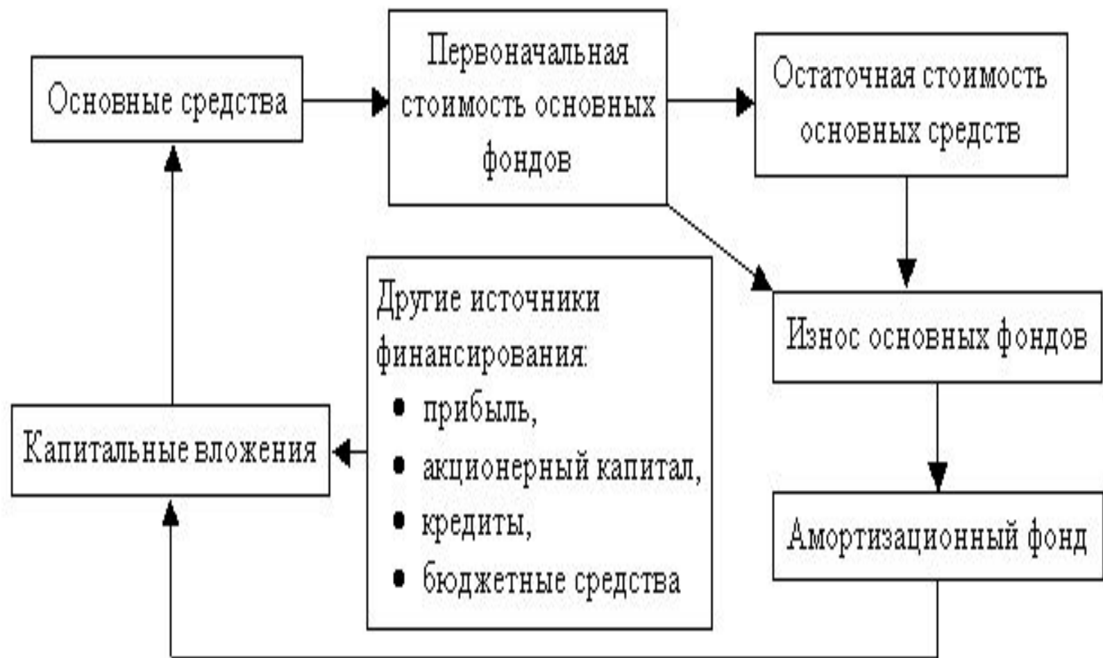
Рис. 8. Крутооборот стоимости основных фондов (средств)