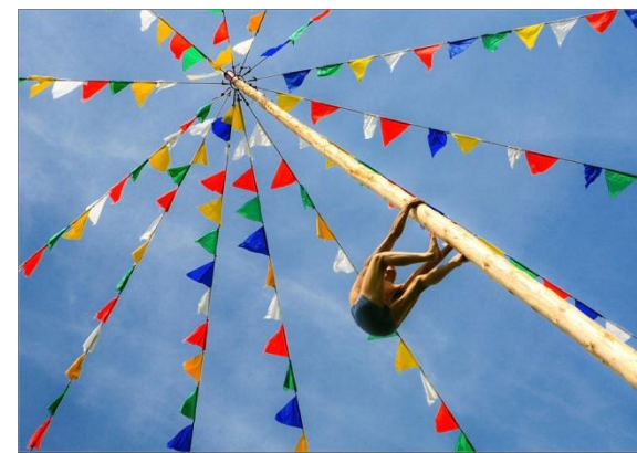
Карабканье по очень высокому гладкому столбу