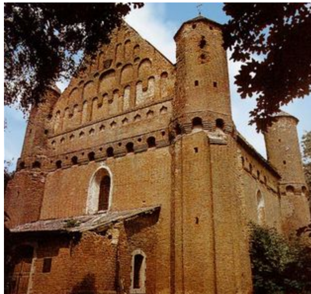
Сынкавічская царква, 15-16стст.