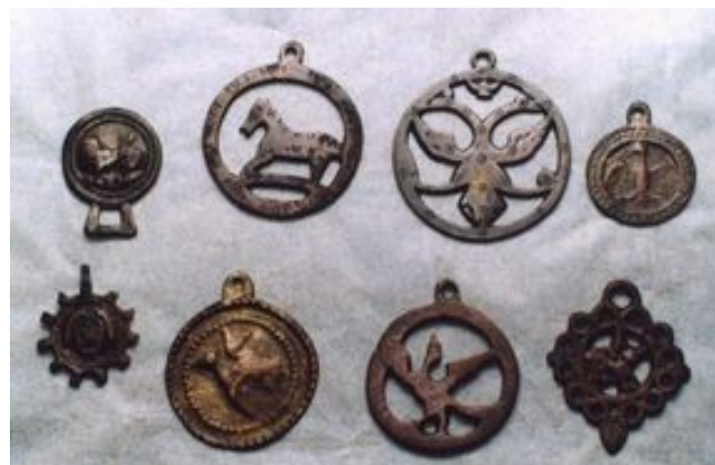
Металічныя прывескі 15-16 стст., Гродна