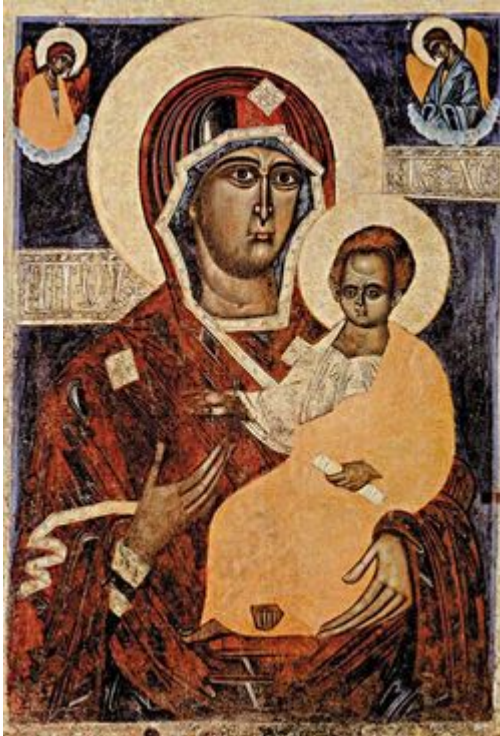
Ікона “Адзігтрывя” Смаленская, 16 ст.