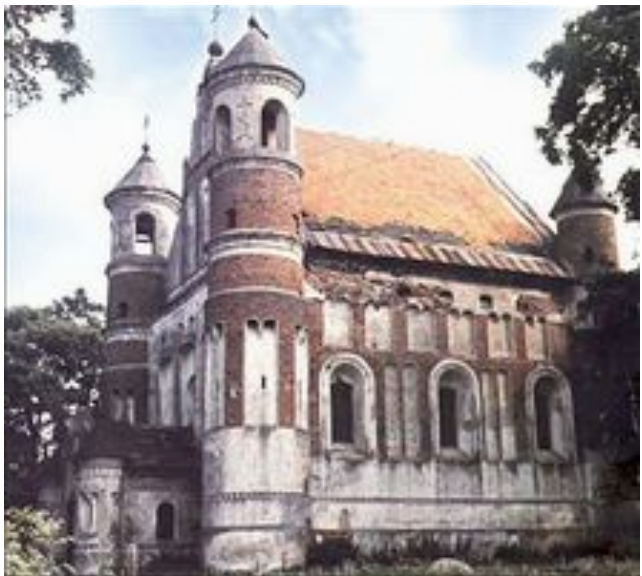
Мураванкаўская інкастэляваная царква, пач. 16 ст.