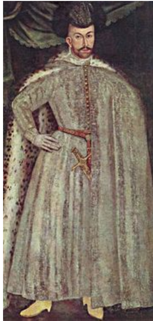
Парсуна князя Міхайлы Барысавіча, 16 ст.