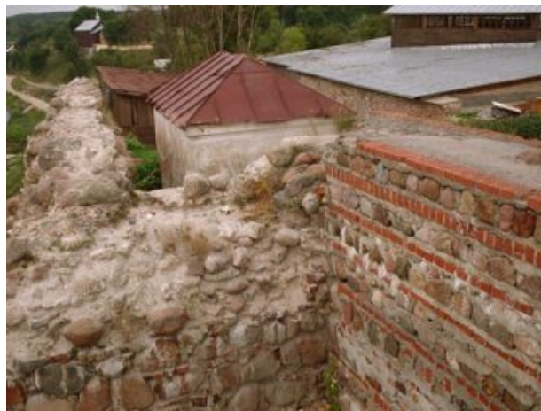
Стары замак у Гродне