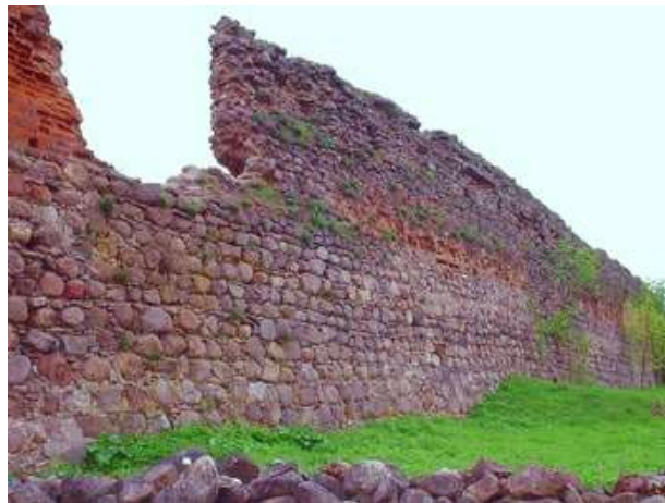
Замак у Крэва (сучасны выгляд)