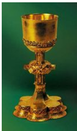
Залаты пацір 16 ст., Навагрудак