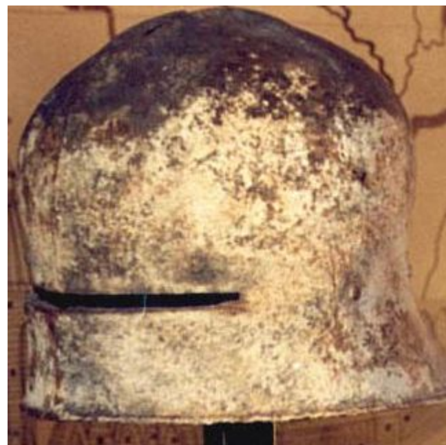
Рыцарскі шлем 16 ст., Мсціслаў