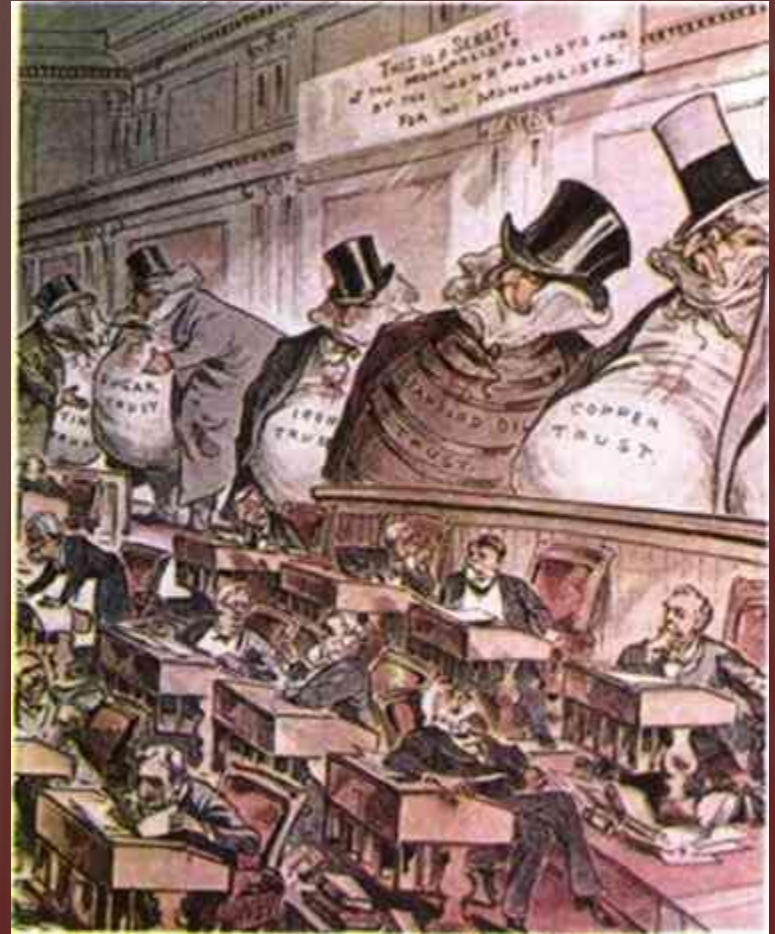
«Сенат монополій, обраний монополістами і служить монополіям» (Карикатура 1889.США)