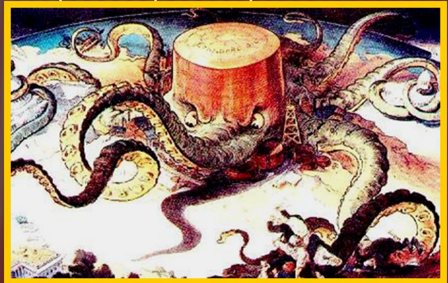
Карикатура на американські монополії