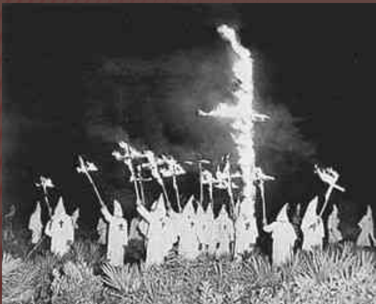
Члени організації на тлі знаменитого символу «палаючого хреста»