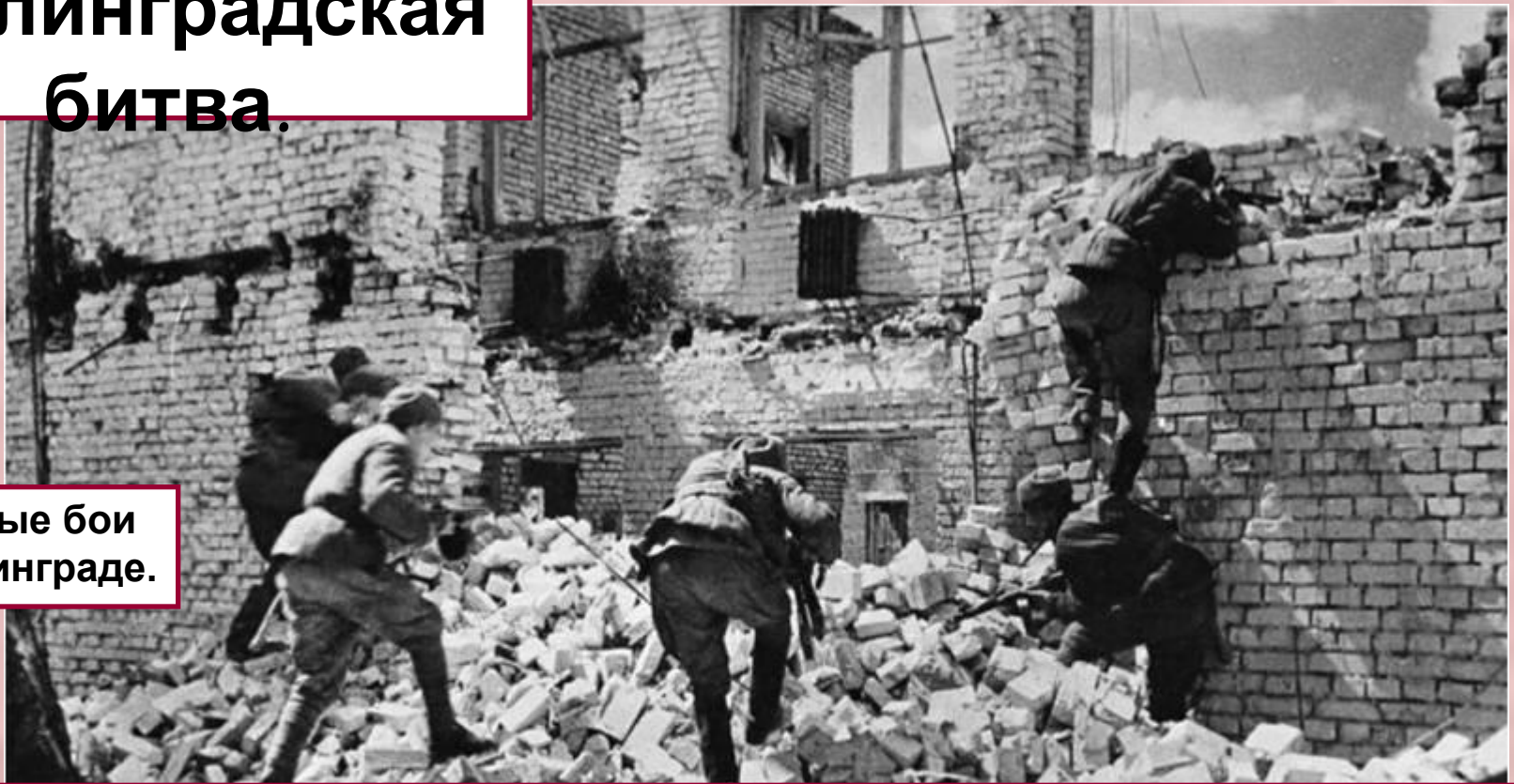
Уличные бои в Сталинграде.

В октябре Жуков и Василевский разработали план контрудара под Сталинградом- «Уран» . К югу и к северу от города были тайно переброшены многочисленные резервы и 19 ноября 1942 г. Красная армия нанесла удар.