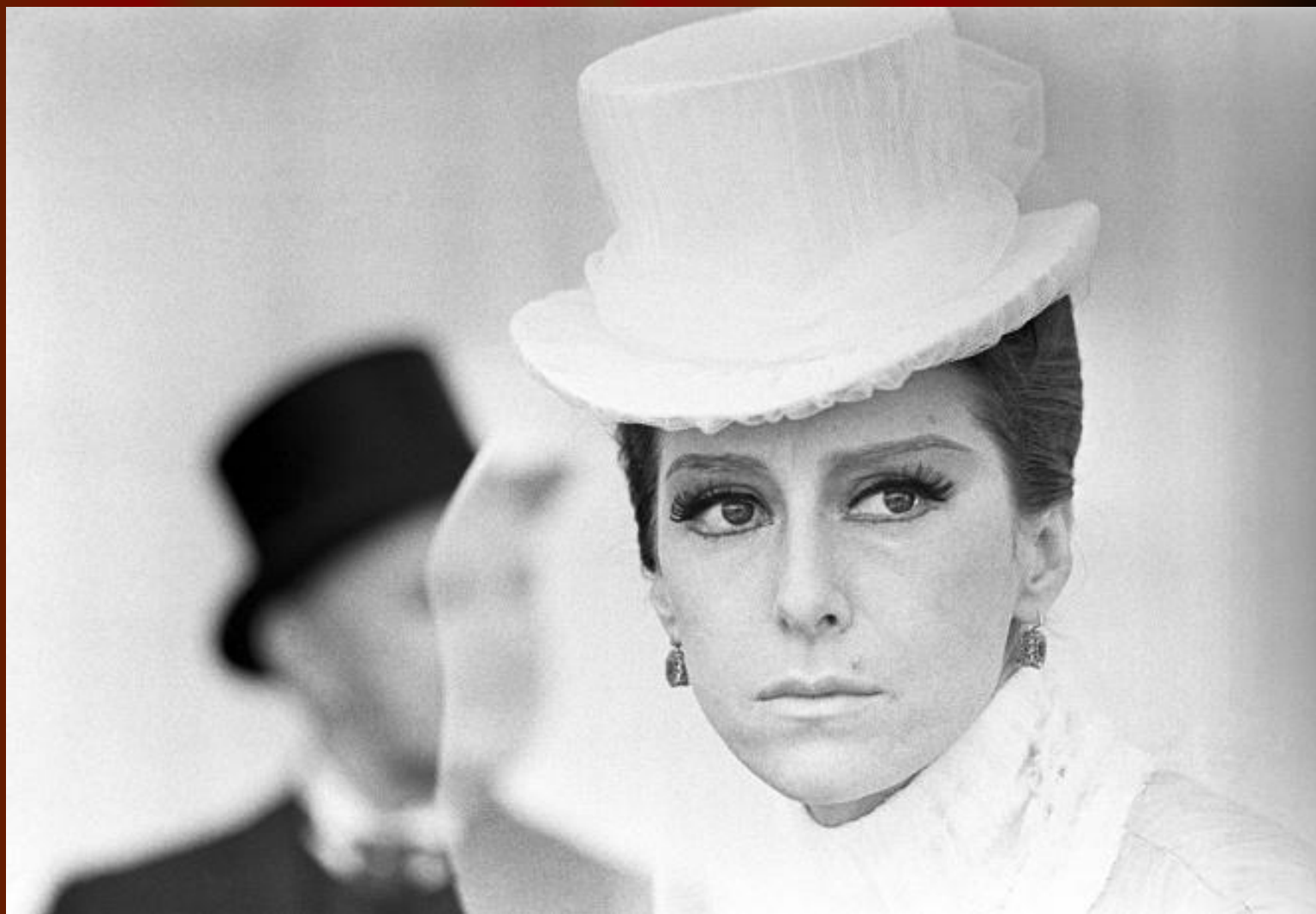
М.М.Плисецкая на съемках фильма «Анна Каренина»