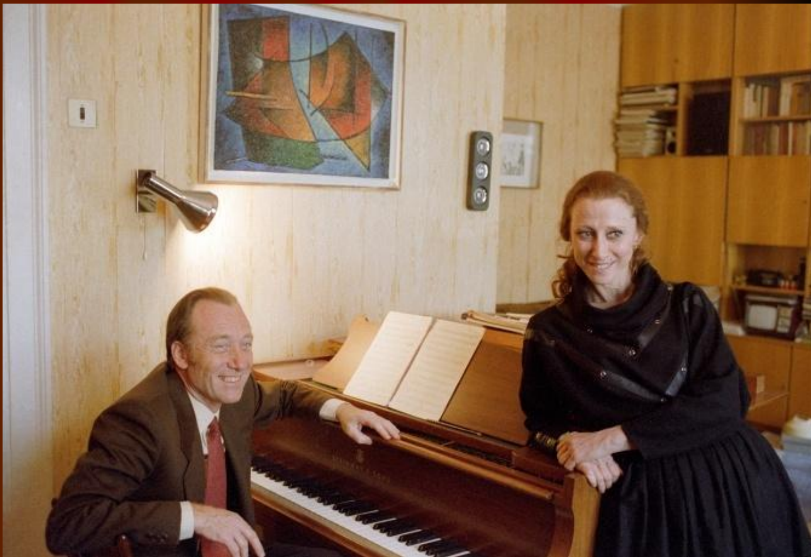
Майя Плисецкая и Родион Щедрин