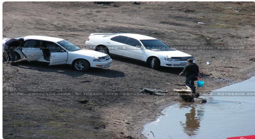
Мойка машин у реки. Загрязнение окружающей среды